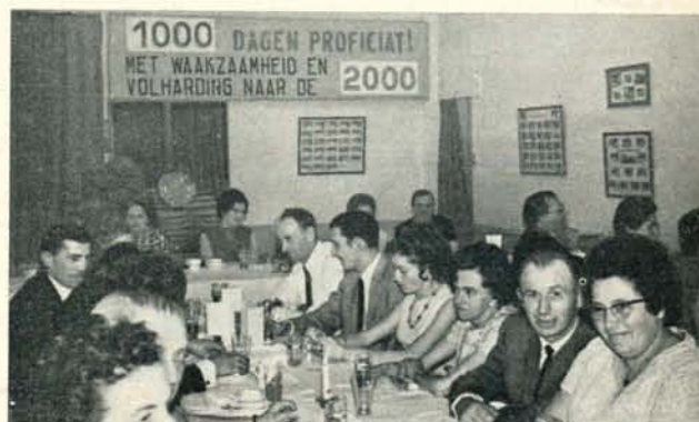
Limburg ziet naar de toekomst. Pas zijn de 1.000 dagen bereikt en reeds worden de 2.000 dagen in het vooruitzicht gesteld.