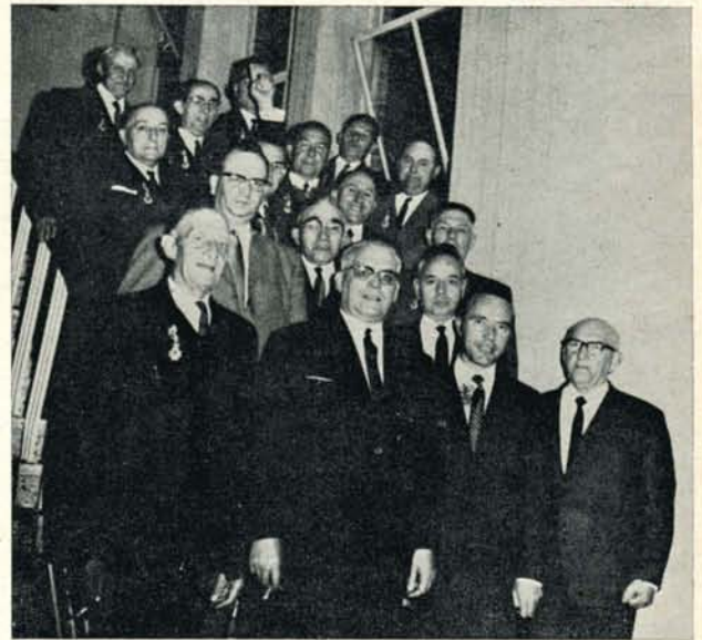
Op de eerste rij herkent men de heer minister Bertrand omringd door de gedecoreerden.

Tot slot dankte de heer W. Vuerstaek de heer Minister en verzocht hem ook zijn dank te willen overmaken aan zijn collega de Minister van Sociale Voorzorg.