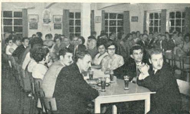
De aanwezigen luisteren aandachtig naar een van de toespraken.

In wel gekozen bewoordingen herinnerde spreker aan de spijtige toestand, die er bestond vóór er van werkelijke veiligheidsactie sprake was; hij wees er vervolgens op dat de noodzaak van deze