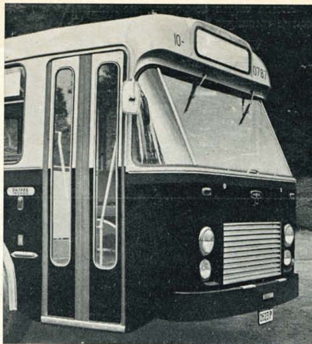
Het voorste deel van het nieuw voertuig. Men bemerkt dat de voorruit hoger is en een grotere helling heeft en eveneens dat de halogeenmistlichten alzo beter beschermd zijn.

Hieruit volgt dat de carrosserie van de 150 nieuwe autobussen, die gedurende de eerstvolgende weken in dienst genomen worden, volledig opnieuw moest be-