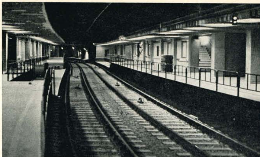
Het station « Munt » tijdens de voltooiingswerken.

De studies en peilingen hebben aangetoond dat het Brussels net aanleiding geeft tot concentraties, die op de punten omgezet worden in een capaciteit van 7.000 tot 10.000 reizigers per uur. Men is dus ruim beneden de voorwaarden van een normale metro, die een capaciteit van 40.000 tot 50.000 plaatsen per uur kan verzekeren. Anderzijds geeft elkeen zich rekenschap dat de bouw van dat vervoermiddel zeer koste-