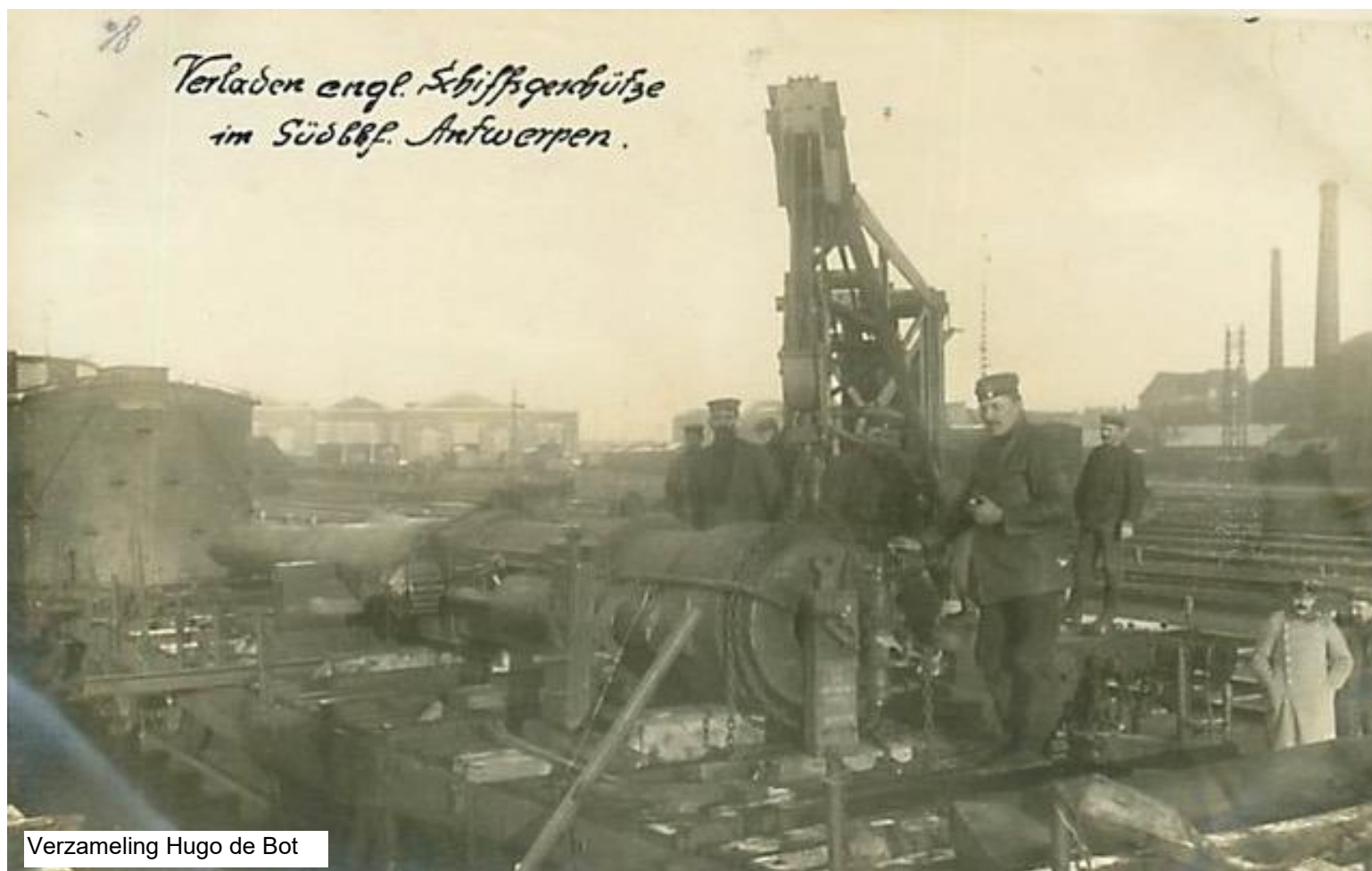
Een Brits scheepskanon wordt na de val van Antwerpen in Antwerpen-Zuid op een wagon geladen voor verzending naar Duitsland. Op de achtergrond het gebouw van het goederenstation. Het niet zichtbare reizigersstation bevindt zich rechts.

Studie over het vroegere station Antwerpen-Zuid, de verdwenen en de niet-gerealiseerde spoorlijnen ten zuiden van Antwerpen – Paul Jacops & Jef Van Olmen.