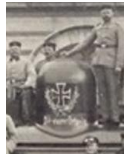
Station Antwerpen-Zuid, Kerstmis 1914, iets meer dan twee maanden na de val van Antwerpen. Een paar honderd Duitsers poseren vóór en op een Belgische locomotief voor een herinneringsfoto. Op het machinistenhuis is het opschrift 'FEBK II (?) Antwerpen Weihnachten 1914' aangebracht en op de stoomdom het bekende zwarte kruis met lauwerkrans. FEBK = 'Feld Eisenbahn Bau Kompanie'.