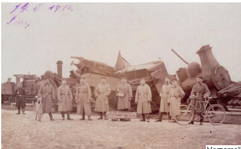
Verzameling Hugo de Bot