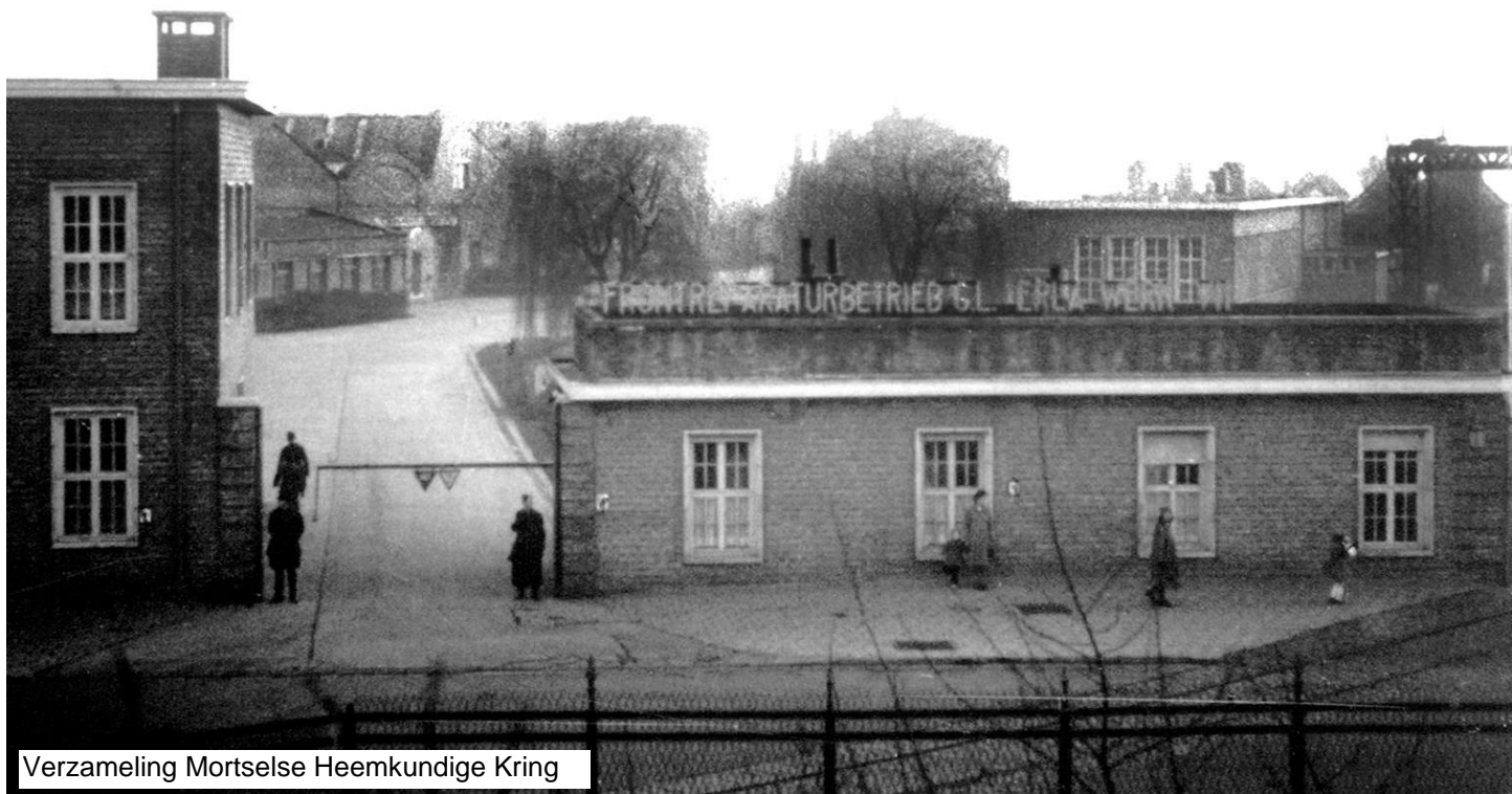
De ingang van het Frontreparaturbetrieb Erla (G.L. Erla-Werk VII) aan de Vredebaan in Mortsel, waarop het aansluitingsspoor naar het goederenstation Luithagen zichtbaar is. De foto is genomen vanop de spoorberm van de fortenlijn.