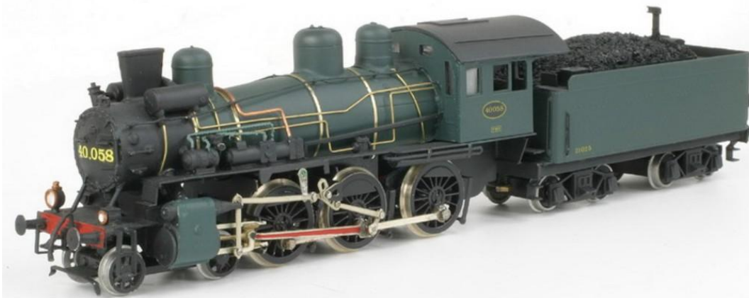
H0-model van Jocadis (hier met Giesl-schoorsteen)