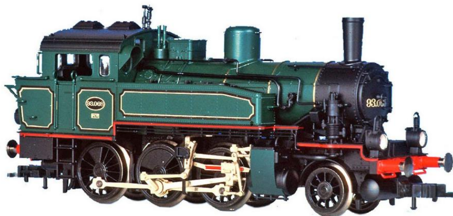
H0-model van Fleischmann