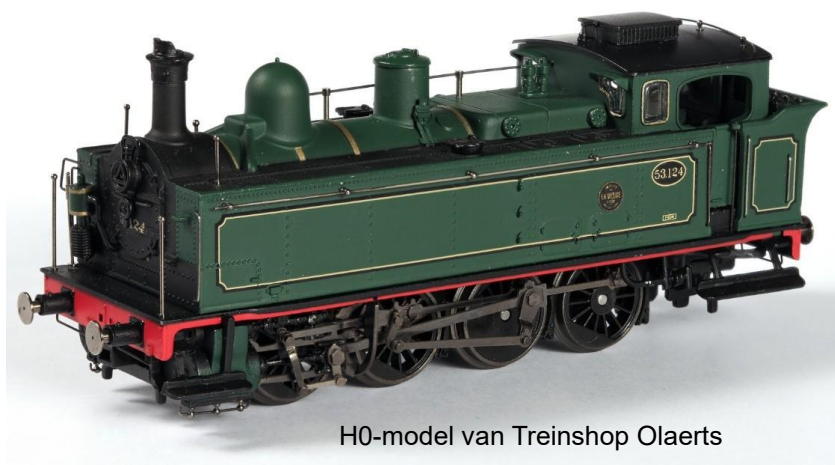
H0-model van Treinshop Olaerts