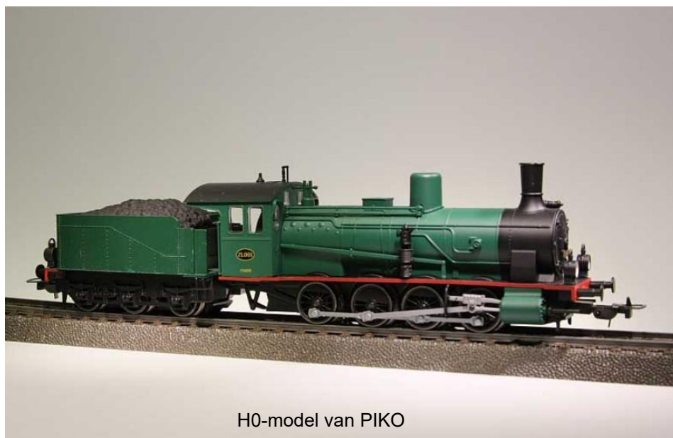
H0-model van PIKO