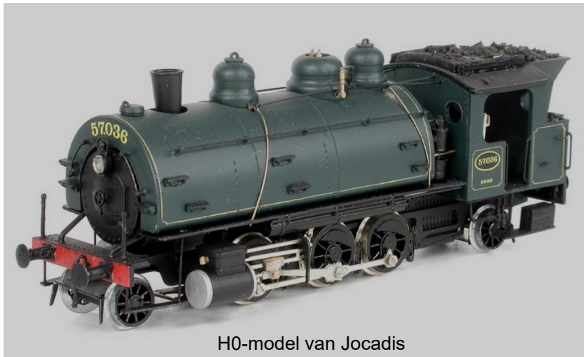
H0-model van Jocadis