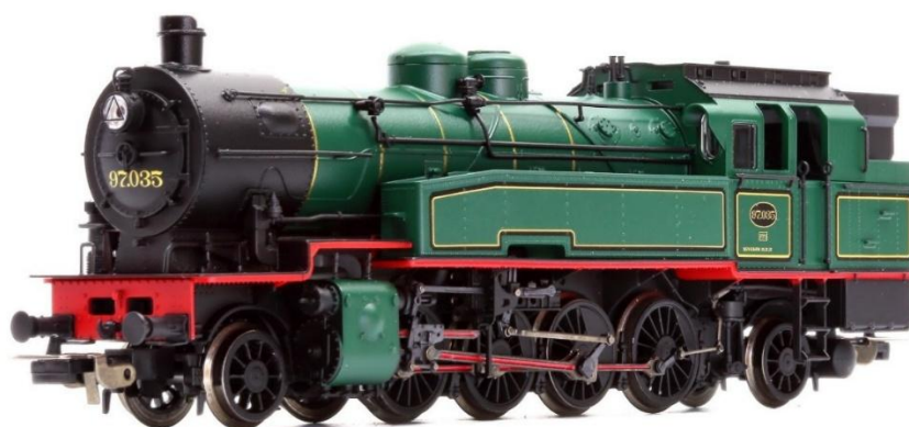
H0-model van PIKO