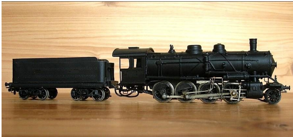
H0-model van DJH

Tijdens WO II: 'Pershing'-locomotieven ex-SNCF, gebouwd in de USA tijdens WO I