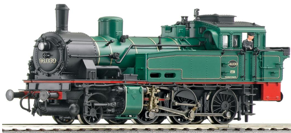
H0-model van Roco