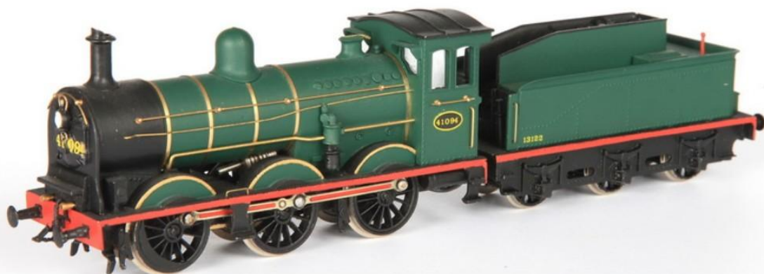
H0-model van Jocadis