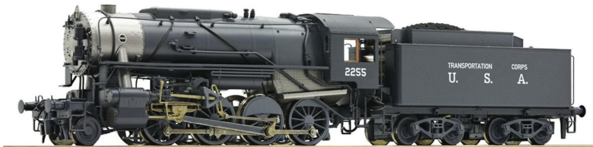
H0-model van Roco

Type 281 (S160 United States Army Transportation Corps)