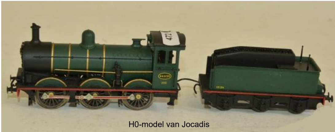
H0-model van Jocadis