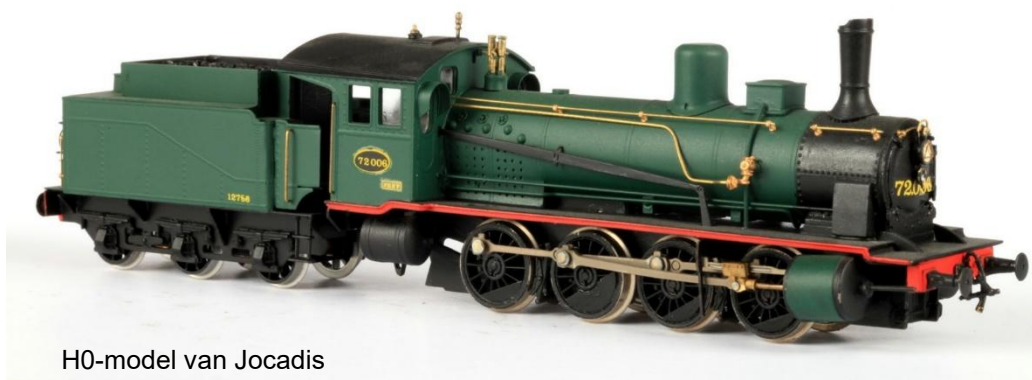
H0-model van Jocadis