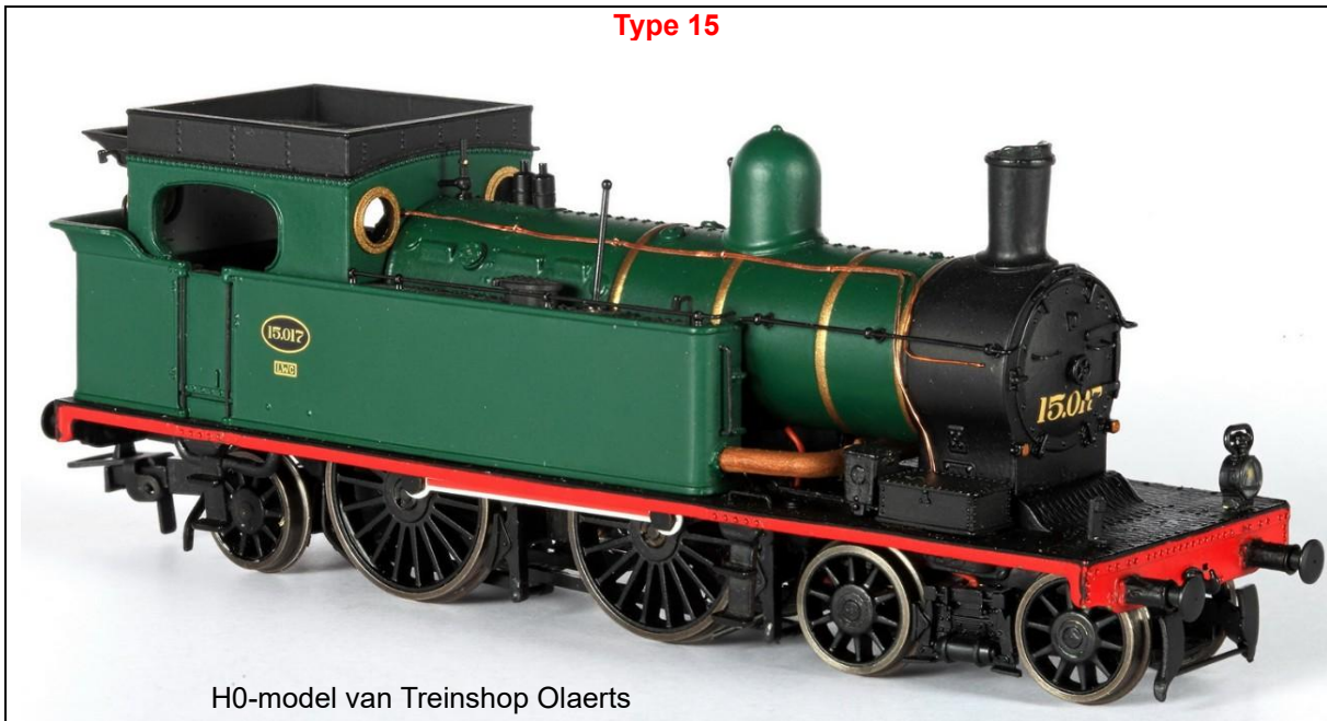
H0-model van Treinshop Olaerts