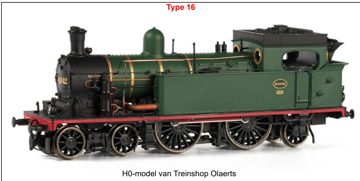
H0-model van Treinshop Olaerts