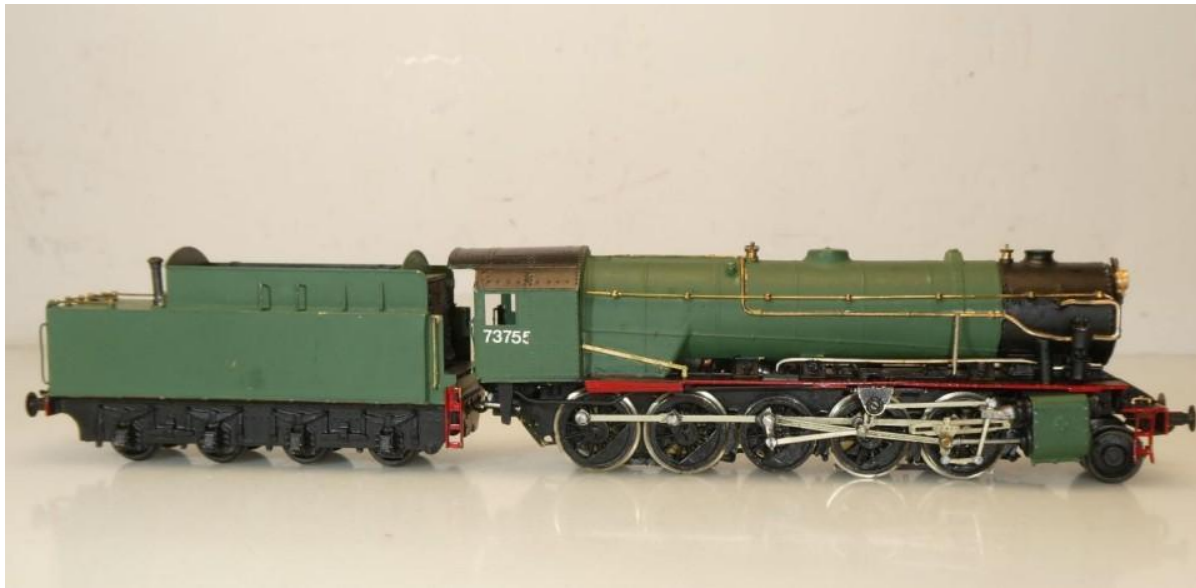
H0-model van Jocadis