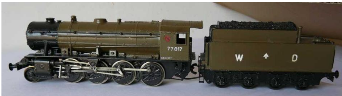
H0-model van Jocadis