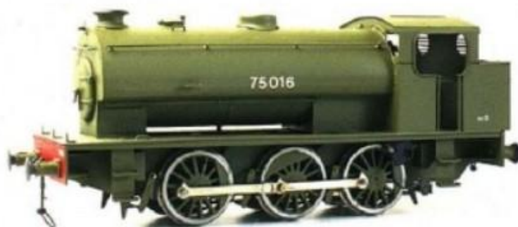
H0-model van PB Messing Modelbouw