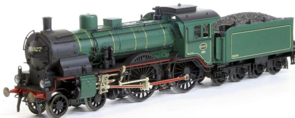
H0-model van Fleischmann