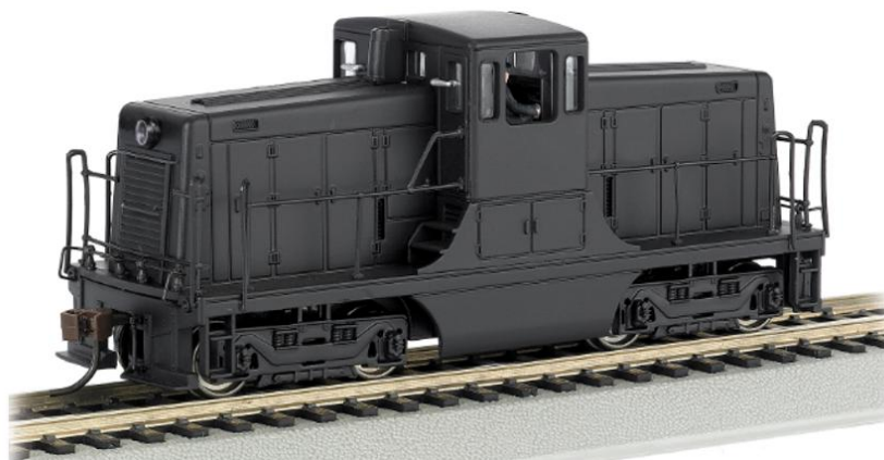
H0-model van Bachmann

United States Army Transportation Corps 44 ton diesel switcher