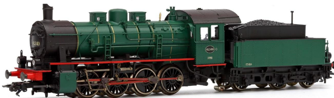
H0-model van Märklin