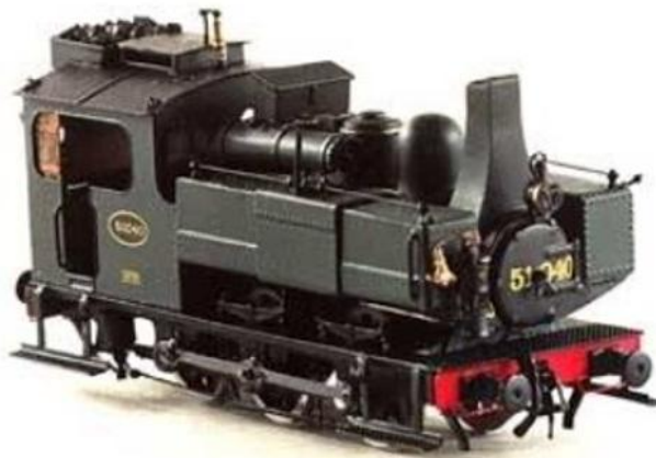
H0-model van PB Messing Modelbouw