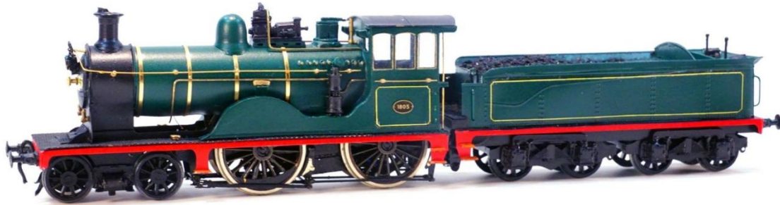
H0-model van PB Messing Modelbouw