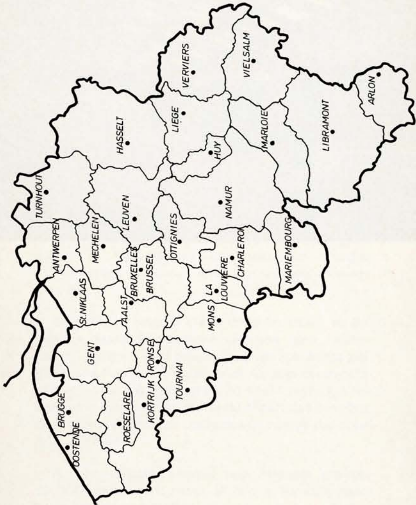
Les Centres Routiers