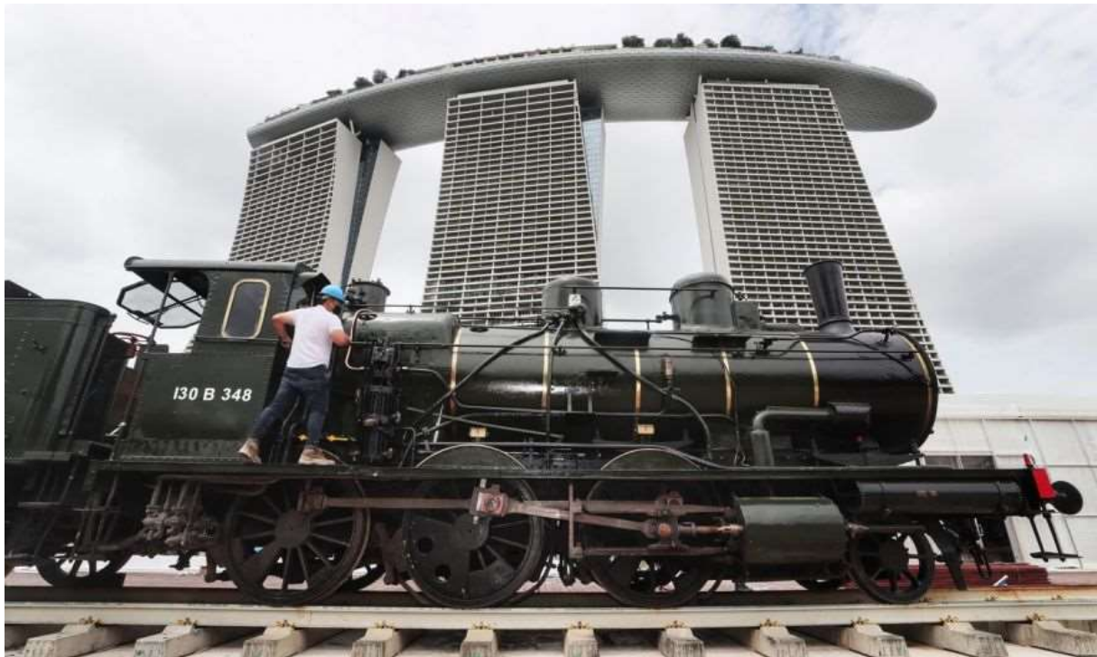
La 130B 348 devant l'Hôtel Marina Bay Sands à Singapour en face le quel se tient l'exposition.