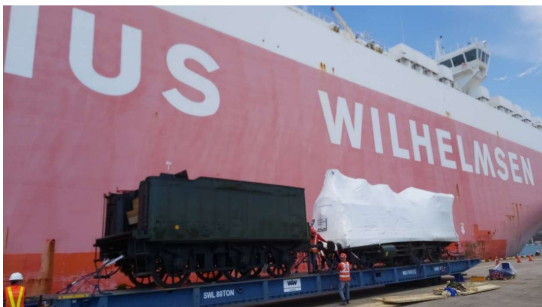
Port de Singapour : débarquement de la loco 130B348 et de son tender.

Concernant Singapour, le correspondant d'OCTRA basé sur place a validé la faisabilité du projet. Aussitôt débarqués du RoRo Tiger sur leurs remorques Mafi, la loco, son tender et les 2 voitures CIWL seraient transférés sur des semi-remorques pour y être acheminés nuitamment par le réseau routier Singapourien vers le lieu de l'exposition. La mise en place définitive sur les voies construites pour recevoir le matériel roulant se ferait par grutage.