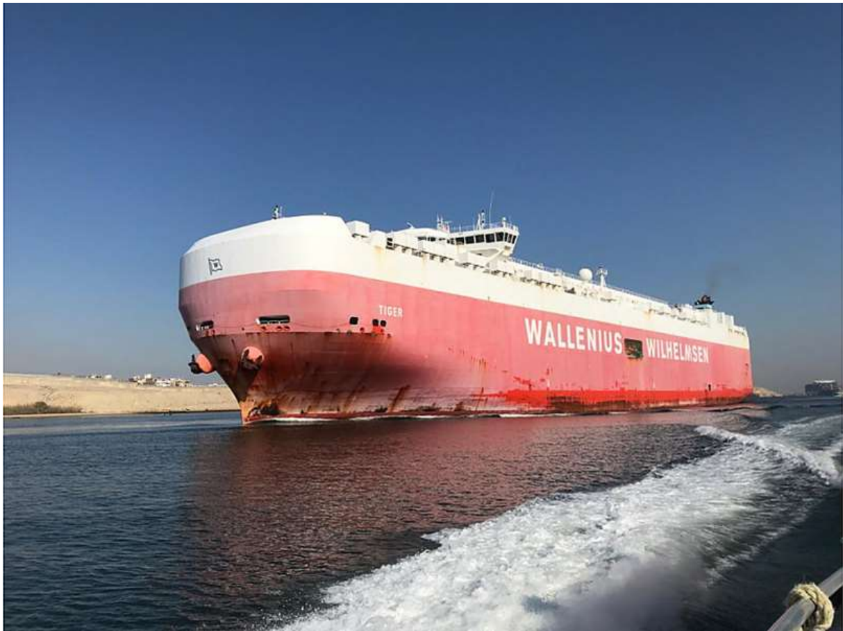
Un autre moment fort du voyage : le Tiger, avec son précieux chargement emprunte le Canal de Suez.