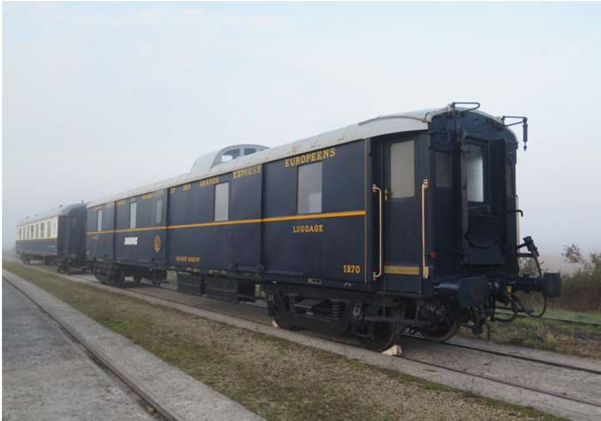
VP 4155 et F 1270 à Léchelle en attente de chargement. B Neveux