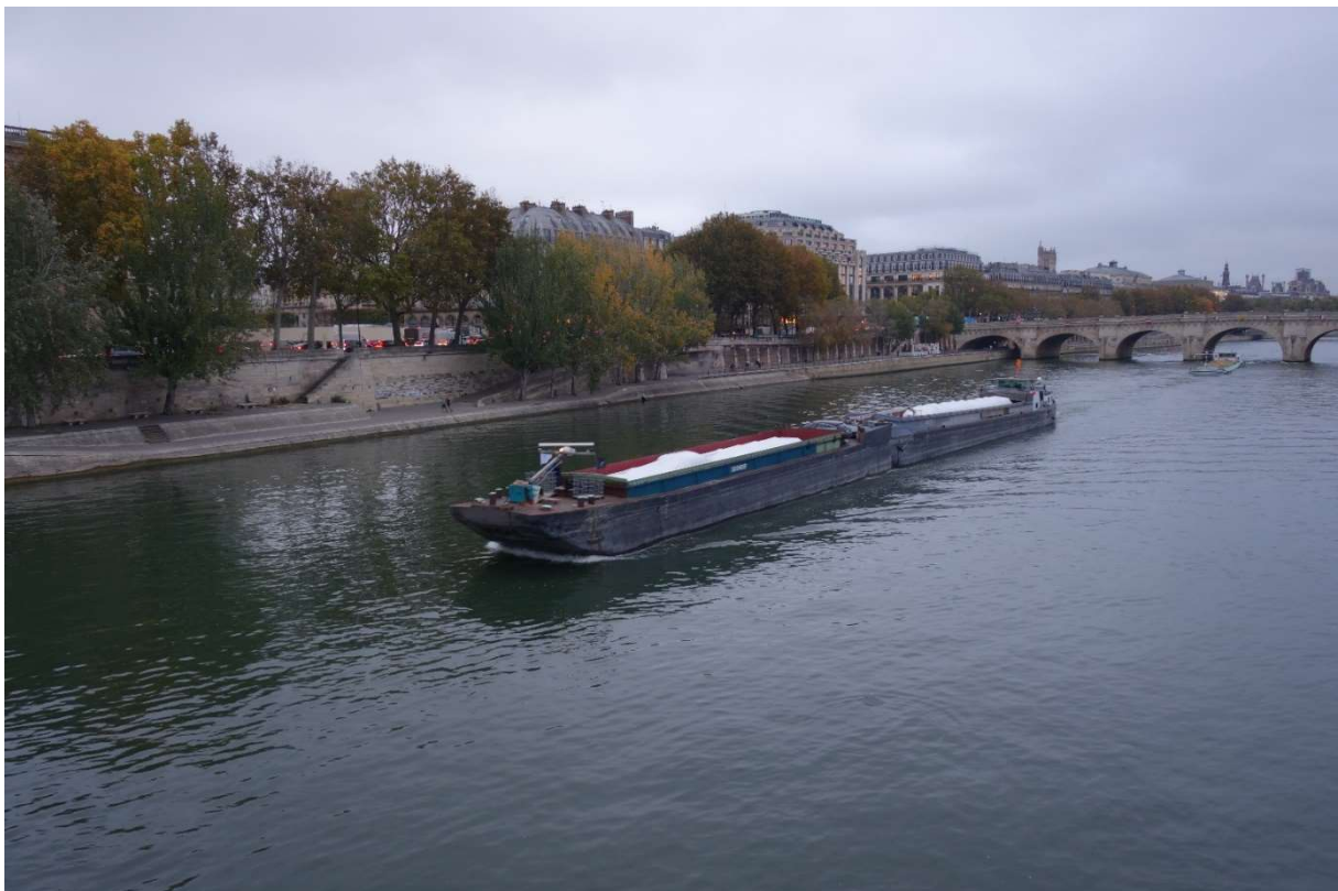
La traversée de Paris de la 4155 et du 1270 sur la Seine devant l'immeuble de l'ancienne Samaritaine.