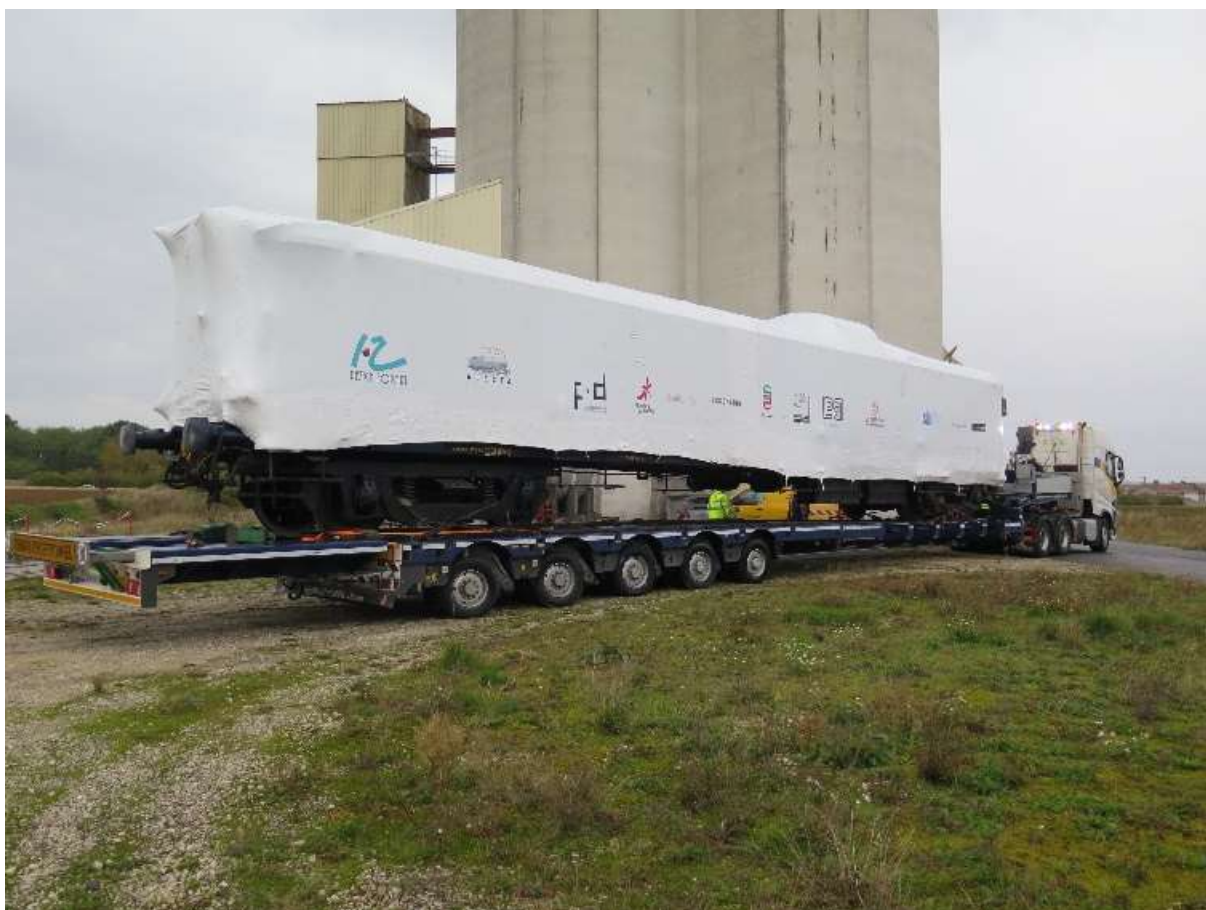
Départ de Léchelle du fourgon 1270 vers le port fluvial de Bray sur Seine. B Neveux

Au cours de l'étude, il fut proposé par OCTRA une solution alternative au transport routier en utilisant le transport fluvial par barge. Le port fluvial de Bray sur Seine n'étant qu'à une trentaine de kilomètres de Léchelle, cette formule éviterait la difficulté d'avoir à gérer des convois routiers exceptionnels de 35 m de longueur avec des hauteurs dépassant les 5 mètres sur un trajet de près de 350 kms.