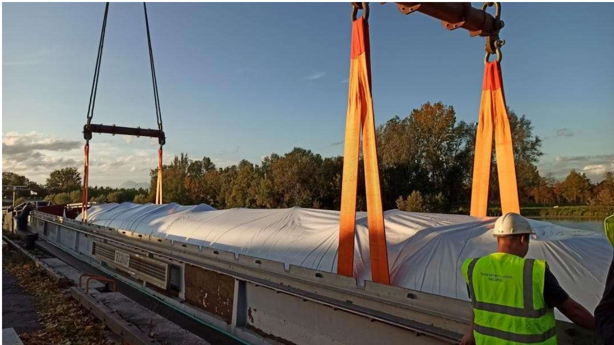
Bray sur Seine : la VP 4155 vient d'être chargé à bord de la barge qui l'acheminera vers le port d'Anvers.

atteindre l'Escaut et le port d'Anvers où le déchargement sur des remorques Mafi s'effectuerait par grutage.