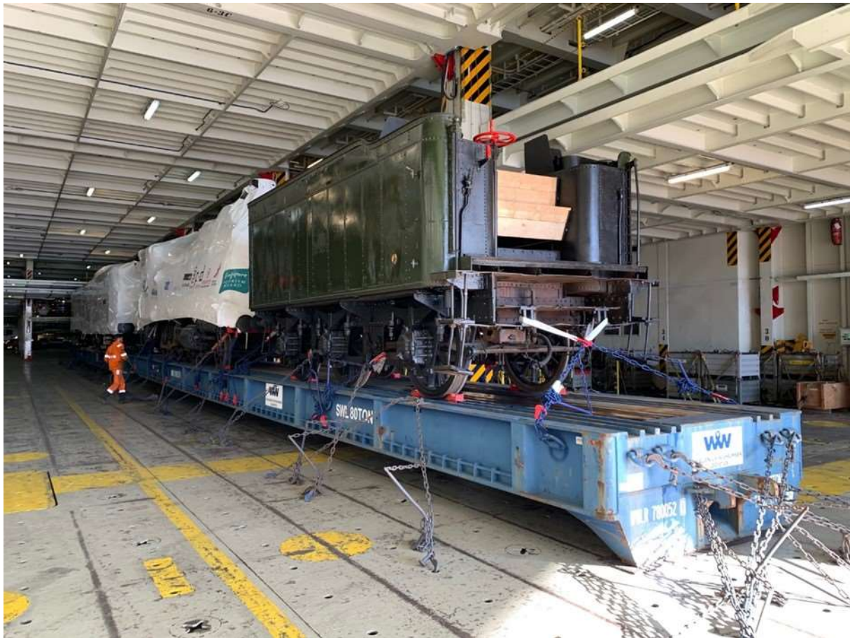
Le matériel Ajecta dans les cales du Tiger.

Concernant Singapour, le correspondant d'OCTRA basé sur place a validé la faisabilité du projet. Aussitôt débarqués du RoRo Tiger sur leurs remorques Mafi, la loco, son tender et les 2 voitures CIWL seraient transférés sur des semi-remorques pour y être acheminés nuitamment par le réseau routier Singapourien vers le lieu de l'exposition. La mise en place définitive sur les voies construites pour recevoir le matériel roulant se ferait par grutage.