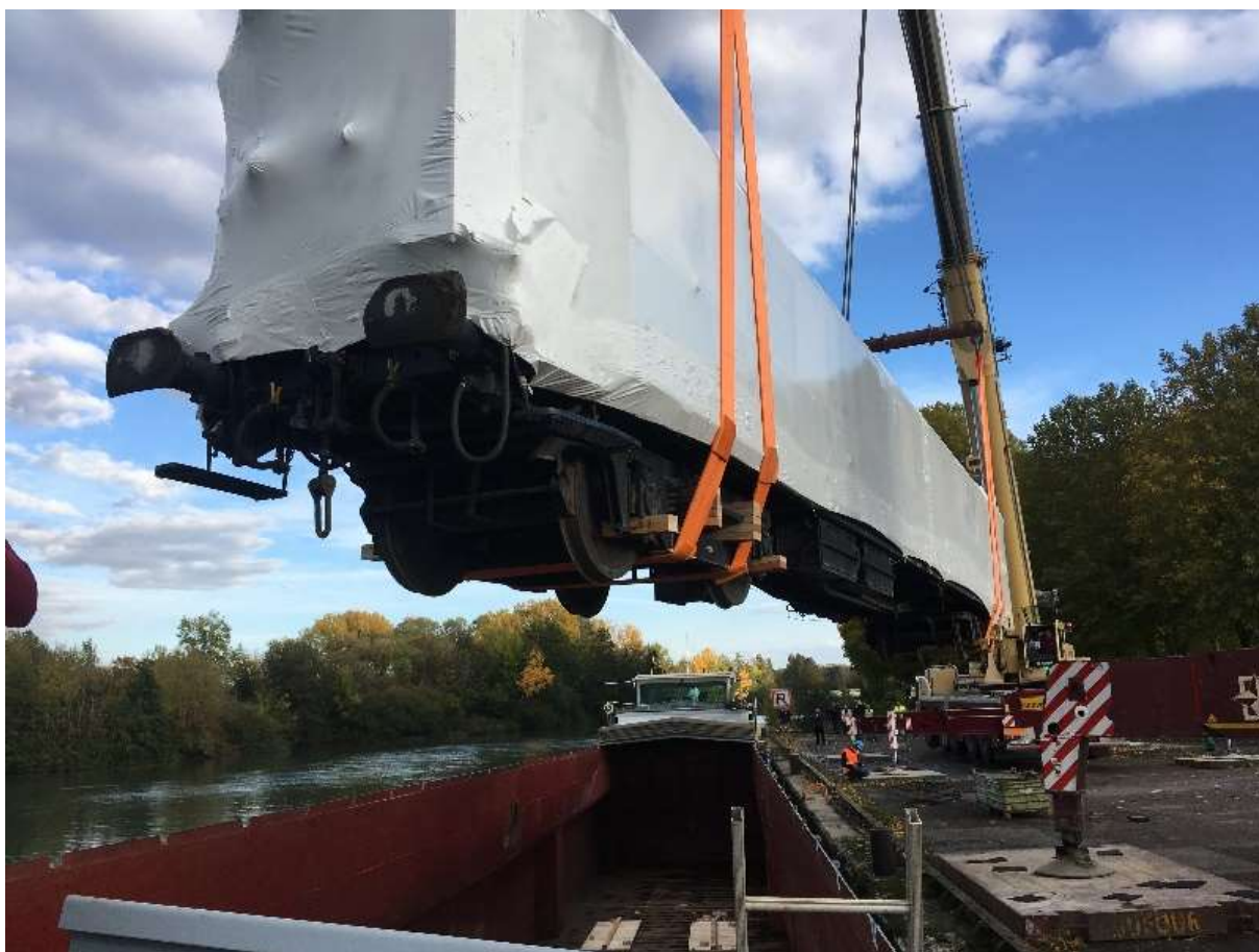
Bray sur Seine : chargement de la VP 4155 à fond de cale de la barge.