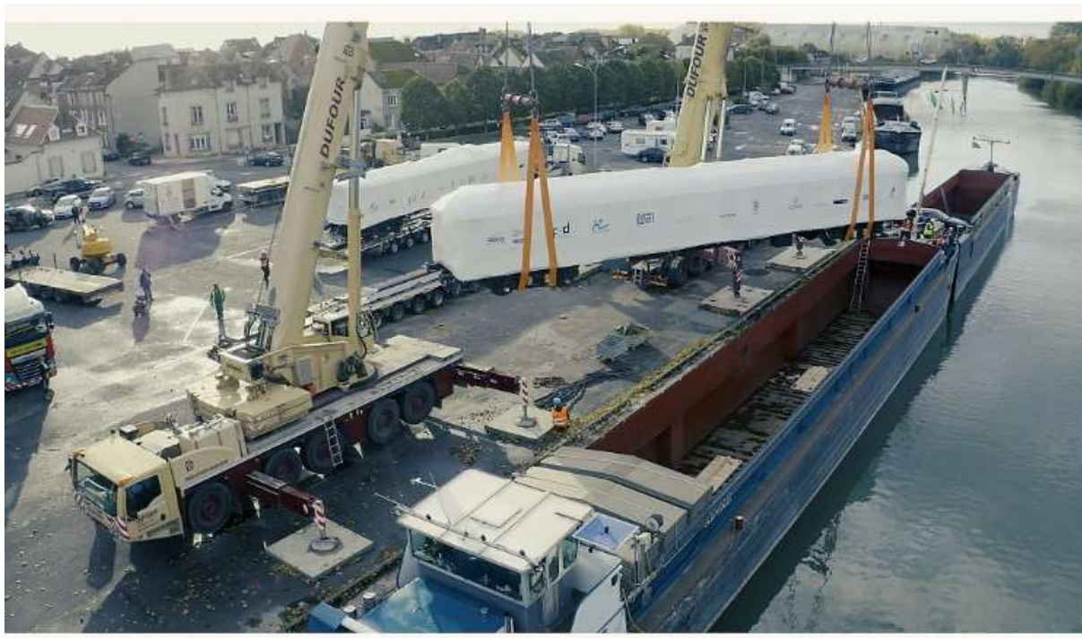
Bray sur Seine : grutage de la VP 4155 à bord de la barge.

De Bray sur Seine, après avoir traversé Paris, les deux barges descendraient la Seine jusqu'à Conflans Ste Honorine pour emprunter l'Oise, puis un réseau de canaux à travers le nord France et la Belgique pour