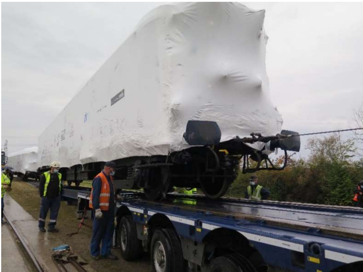
Chargement par rampe de la VP 4155 à Léchelle. B Neveux