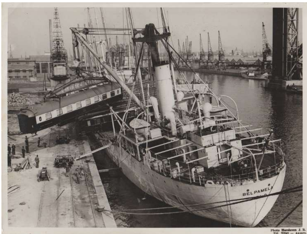
En 1937 la CIWL charge à Anvers sur le Belpamela, la VP 4062 à destination de Hong Kong. La caisse est grutée séparément des bogies par les mats de charge du navire.