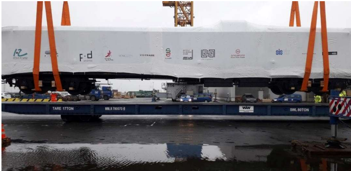
Port d'Anvers : mise en place F 1270 sur remorque Mafi.