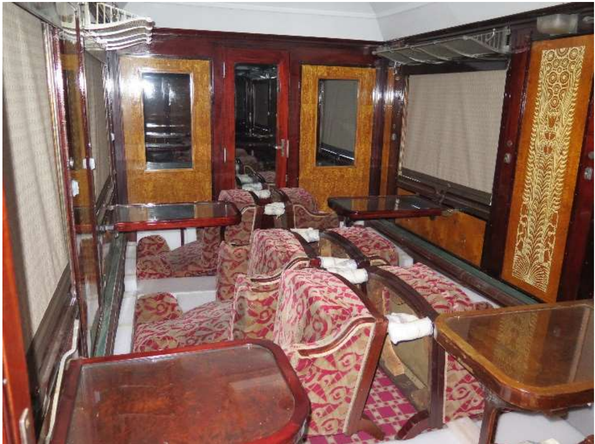
VP 4155 : calage du mobilier. B Neveux