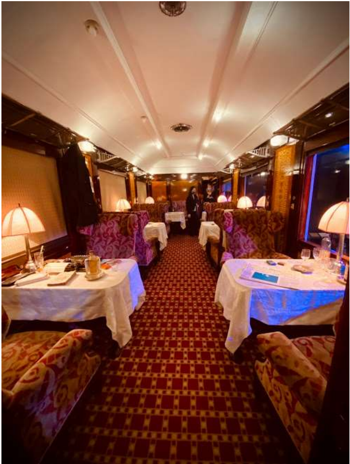
L'intérieur de la Pullman 4155 mis en scène par Clémence Farrell