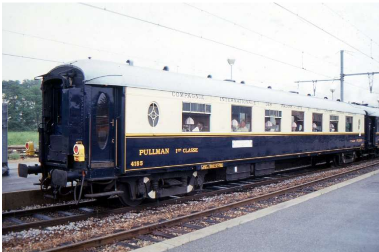
Photo: VP 4155 of the AJECTA on 6 June 1995

AJECTA has long owned the Pullman type Côte d'Azur N° 4155, which was used on the Sud-Express until 1971. An appeal for donations by the AJECTA saved it from being scrapped at the time, and it has been running for the association ever since.