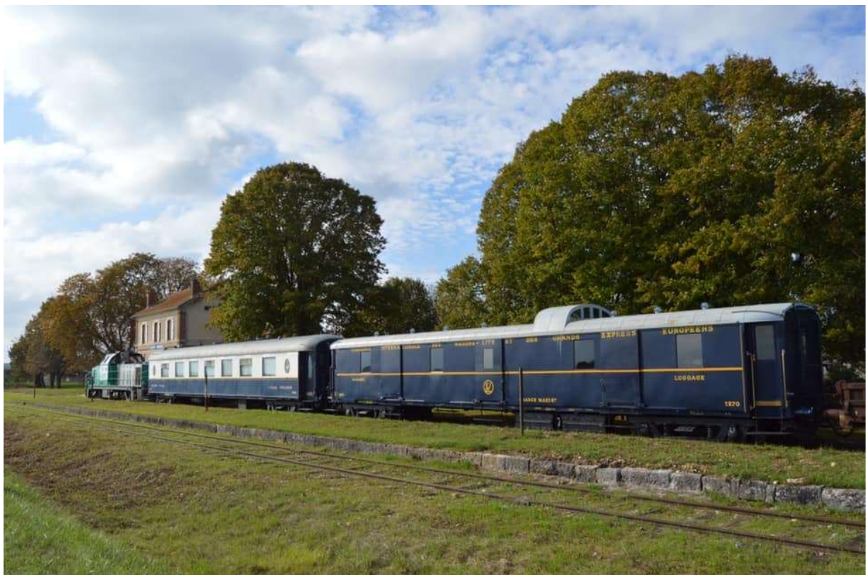
VP 4155 et F 1270 en gare de Villiers St Georges.