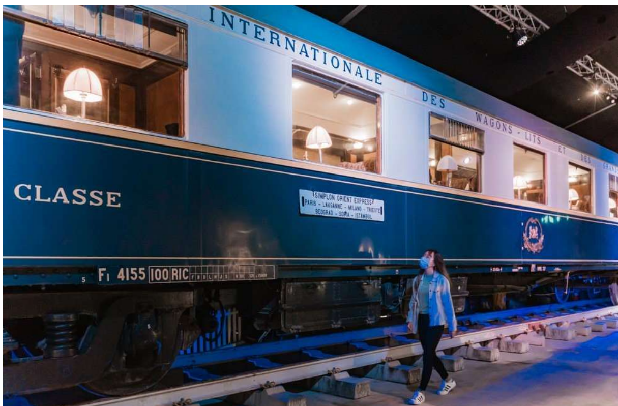
La voiture Pullman 4155 de l'Ajecta en place dans le bâtiment spécialement construit pour l'exposition « Once upon a Time on the Orient Express »