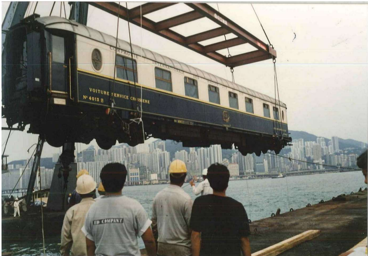
En 1988 embarquement à Hong Kong pour le Japon de la Voiture Service Croisière 4013 de la CIWL. La même méthode sera utilisée pour les 3 grutages de la VP 4155 et du Fourgon 1270.

Ce transport hors norme qui aura nécessité des moyens logistiques considérables s'est déroulé dans les meilleures conditions et le matériel est arrivé à bon port sur le site de l'exposition. Pour ce faire, OCTRA aura mobilisé une loco du Fret SNCF, quatre camions semi-remorque (2 en France et 2 à Singapour), six grues (2 à Bray sur Seine, 2 à Anvers et 2 à Singapour) avec leurs camions d'accompagnement, 2 péniches fluviales, 3 remorques Mafi et un navire RoRo pour la traversée maritime. A cela, il faut ajouter le camion qui a transporté la rampe de chargement et divers élévateurs du type Manitou pour les manutentions associées.