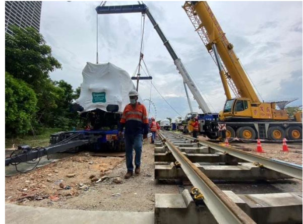
Gardens By The Bay à Singapour : acheminement et déchargement.

Le trajet du Dépôt de Longueville vers le port d'Anvers s'avérait beaucoup plus complexe à mettre en œuvre. Il y a deux moyens d'extraire un matériel du Dépôt : par le rail ou par la route en le chargeant sur un camion spécialisé pour le matériel ferroviaire. L'accès routier du Dépôt se fait par une route pentue en courbe, limitant ainsi la longueur et le tonnage des convois exceptionnels qui l'empruntent. Cette disposition ne permettait ni à la Pullman 4155, ni au fourgon 1270 d'emprunter cette voie ; seuls la loco 130B 348 et son tender 20A 30 plus courts, pourraient utiliser cette voie de sortie. Il fut donc décidé que la loco et le tender seraient chargés par rampe sur deux camions pour rejoindre le port d'Anvers par voie routière en convoi exceptionnel à travers la France et la Belgique. A Anvers, le matériel serait transféré sans grutage sur des remorques Mafi.