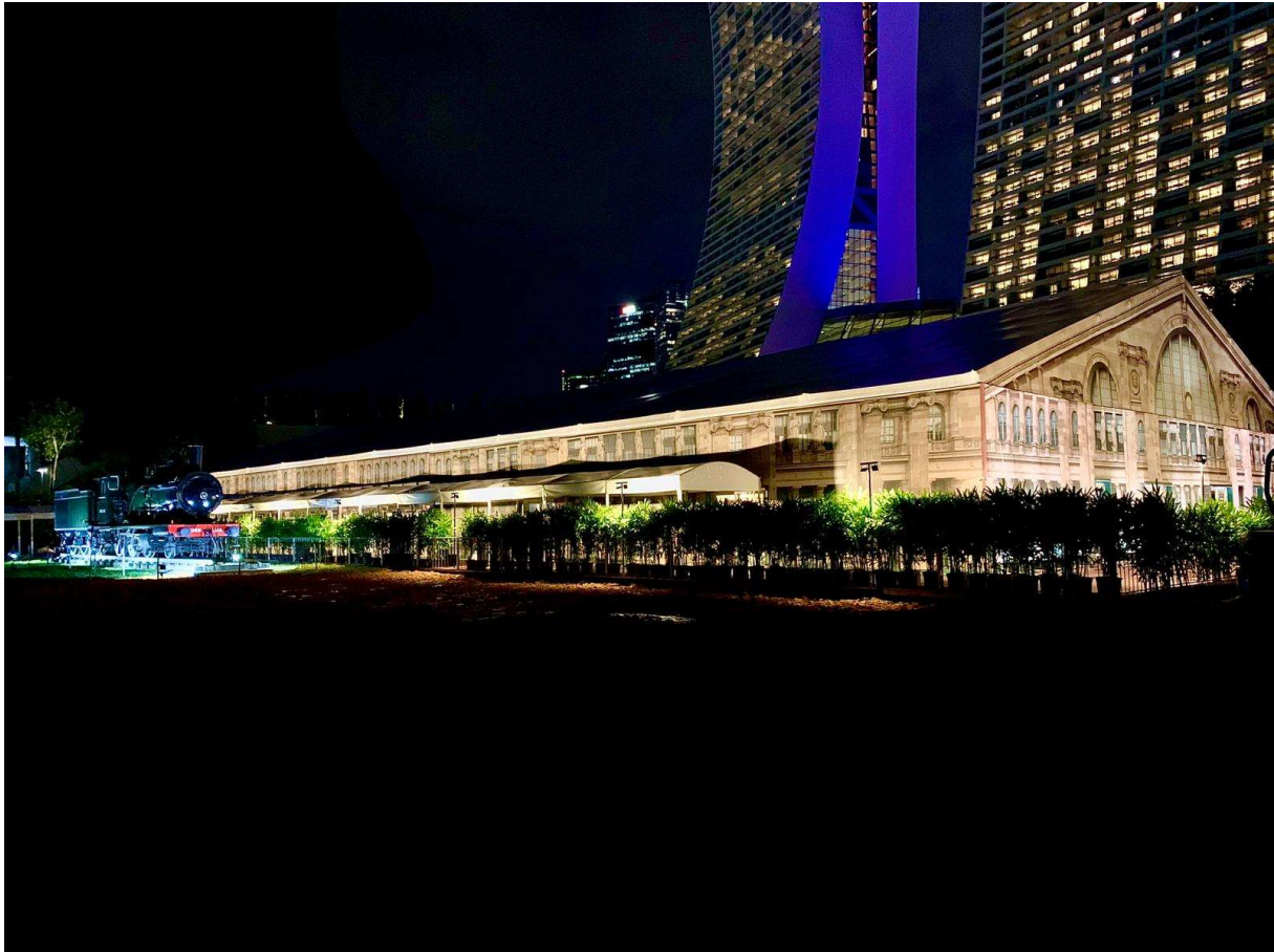
La structure temporaire qui abrite l'exposition avec sa décoration inspirée de la Gare du Nord à Paris