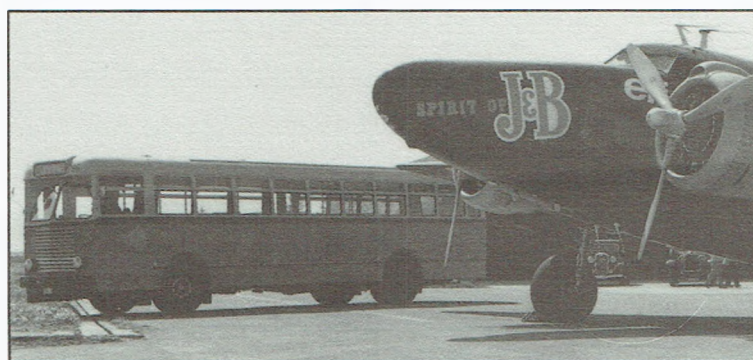
De AMN 995 en de «Spirit of J&B», twee kranige oudjes verenigd.

U weet ongetwijfeld al of de avonturiers erin geslaagd zijn om met dit vliegtuig het