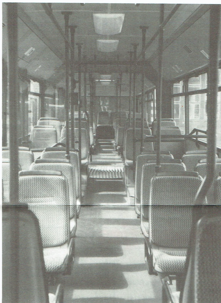
▲ Een zicht op het interieur. De handgrepen, die horizontaal vlak bij het plafond geplaatst zijn, kregen negatieve kritieken.

achtertrein bij het verlaten van de halte. Voor de goede orde: de geteste Mercedes-bus wordt geduwd, onze gelede bussen worden getrokken. Ten slotte vonden de chauffeurs ook de betaaltafel te klein.