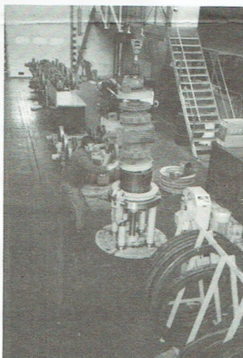
Het monteren van nieuwe wielbanden op de wielbandpers.

Na een grondige controle worden de draaistellen terug samengesteld en gemonteerd onder de kast van het rijtuig.