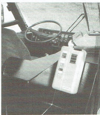
Een algemeen zicht op de stuurpost. De ontwaarder bevindt zich in de onmiddellijke nabijheid van de chauffeur. (illustratie : LAG)