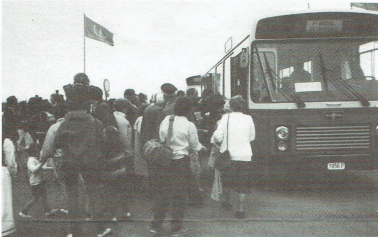
Onze voertuigen werden letterlijk bestormd door een stroom van mensen.