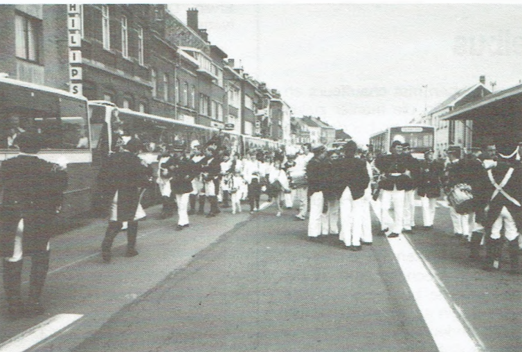
Een massa belangstellenden voor het station van Eigenbrakel. Duizend tweehonderd "grognards" (soldaten uit de garde van Napoleon 1) maakten gebruik van onze gelede bussen, die hen naar Ophain brachten.