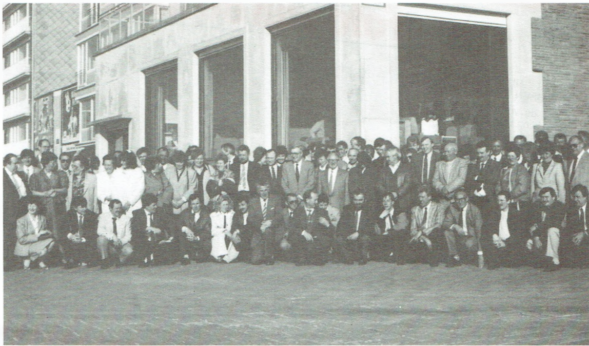
Onze collega's van Assebroek samen met alle genodigden verenigd voor de gelegenheidsfoto.

De Algemene Dienst voor Veiligheid, Hygiëne en Verfraaiing van de werkplaatsen, hield op 17 mei jl. zijn jaarlijkse vergadering. Net zoals vorige uitgave daagden de vertegenwoordigers van de winnende ploegen en de winnaars van de intergroepenwedstrijd in grote getale op. Assebroek is één van de groepen die de top haalden i.v.m. het aantal werkdagen zonder ongeval. Een uitgebreid verslag daarover volgt onderaan.