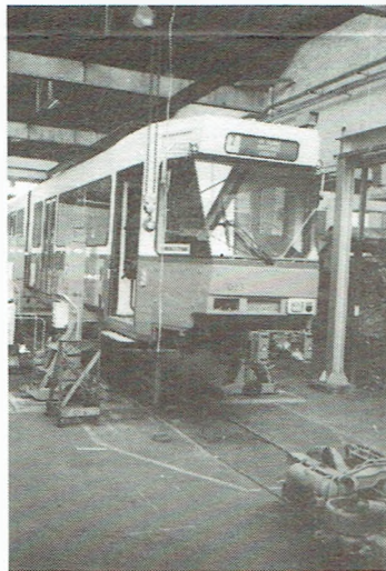
Het lichten van een rijtuig gebeurt door een heftoestel. Rechts onderaan kan je een draaistel, dat van de kas werd losgemaakt, zien.