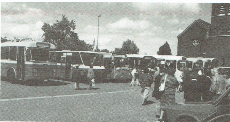
Een "familiefoto" van de bussen: van de alleroudste tot de modernste.

Alle openbaar vervoer-chauffeurs, zowel van de Buurtspoorwegen als van de Maatschappijen voor Intercommunale Vervoer, kunnen deelnemen. Een eerste proef selecteert de kandidaten voor de tweede fase, nl. de kennis van de wegcode. Spannende gymkanaproeven rondten het geheel af. In een volgend nummer zullen we resultaten in een kort artikeltje verwerken.