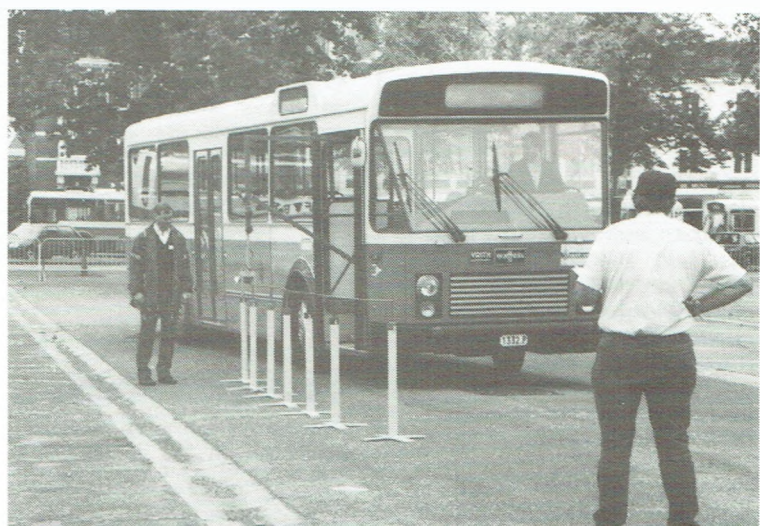
De "zig-zag"-monorail was wellicht één van de moeilijkste onderdelen. De ijzeren stang aan de zijkant van de bus moest de monorail volgen zonder deze te raken. Bij aanraking weerklonk er een schril signaal.

Antwerpen : 12 (4) Oost-Vlaanderen : 2 (2) Henegouwen : 4 (1) Namen-Luxemburg : 24 (9) Luik : 12 (2) Brabant : 2 (-) Limburg : 14 (2) Intercommunale Vervoer Verviers : 4 (1) Exploitanten : 4 (3)