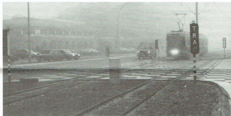
De "tram"-signalisatie, zoals aan de renbaan van Oostende, is zelfs bij dichte mist zeer doeltreffend.

Niemand ontkent dat de voertuigen snel of comfortabel zijn.