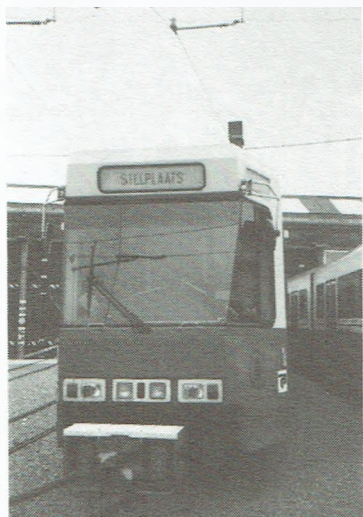
Lichtbeïnvloeding is nu mogelijk door een apparaatje dat op het dak van de tram en op het verkeerslicht geplaatst wordt.