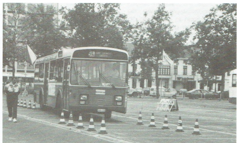
De chauffeur toont pas echt hoe rijvaardig hij wel is met deze proef. Hij moest non-stop door een met verkeerskegels afgebakend traject rijden zonder de kegels aan te raken, omver te rijden, te stoppen of achteruit te rijden. Moeilijker dan je denkt!