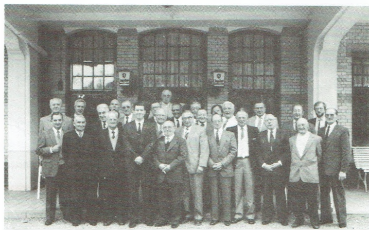
De gepensioneerden van groep Luik kregen op 1 oktober jl. de gelegenheid om elkaar weer te zien. Ook de meest getrouwen onder hen lieten dit buitenkansje niet aan hun neus voorbijgaan. Het weerzien verliep in een opgewekte sfeer.