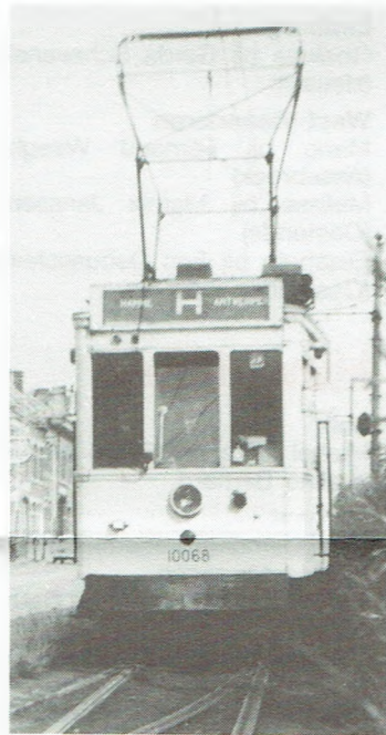
Een tram van de lijn H (Hamme-Antwerpen) op de Viaduct in Temse. Deze foto werd vermoedelijk in 1958 genomen.