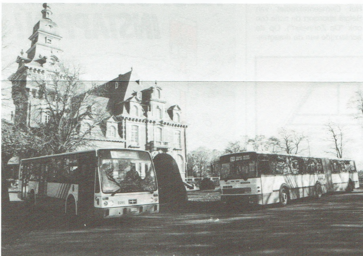
Samen voor het Kasteel van Namen: de nieuwe A 500 en de gelede bus in de recente Buurtspoorwegkleuren.

met een tegen vandalisme bestendige blauwe stof overtrokken zetels. De wanden zijn bekleed met vast tapijt. De vloer is volledig vlak. Hinderlijke opstapjes ontbreken dus. De chauffeur beschikt over een comfortabele stuurpost. Zo'n 150 Naamse chauffeurs werden tijdens een twaalf uur durende scholing vertrouwd gemaakt met de gelede bus. De reizigers werden evenmin vergeten. In de beginfase rijden hostessen en een controleur met de nieuwe gelede bussen mee om de passagiers te begeleiden.