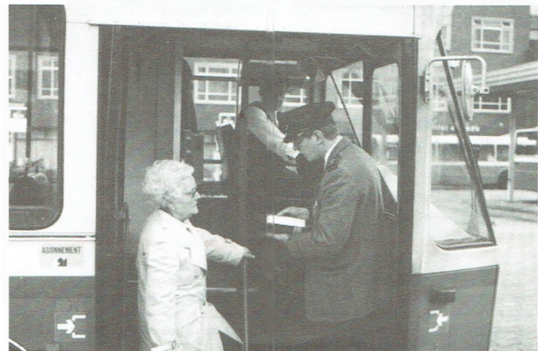
Eén van de vele jobs van een controleur is reizigers inlichtingen verstrekken.