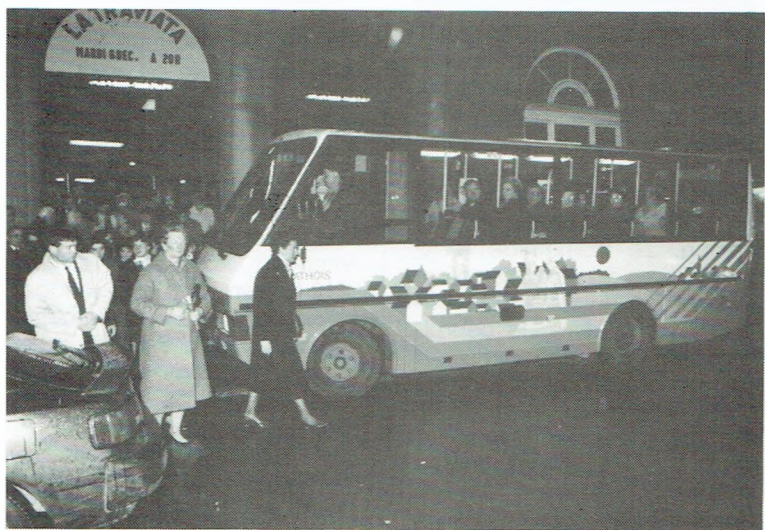
Na het spektakel nemen de passagiers voldaan plaats in onze Particibus, die hen van Bergen naar Aat zal brengen.