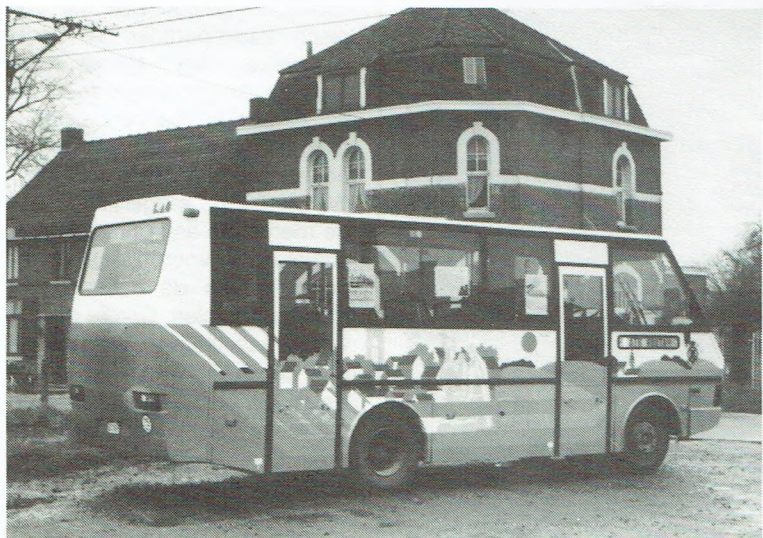
De Aatbus, met zijn typische beschildering op de zijflanken, verbindt het stadscentrum met enkele omliggende gemeentes, waaronder Houtaing.

7,7 % van de ondervraagde reizigers beweerde nog nooit de bus gebruikt te hebben. Dit wil dus zeggen dat er zoveel procent aan klanten gewonnen is. Zonder de eindejaarsactie zou zelfs 21,6 % van de geënquêteerden de bus niet genomen hebben, wat wijst op 21,6 % meer reizen. Onze shoppingkaartactie trok dus nieuwe klanten en verhoogde het busgebruik bij het bestaande cliënteel. De investering in informatie en de gewoontevorming voor nieuwe klanten zullen een positief effect hebben op latere ontvangsten.