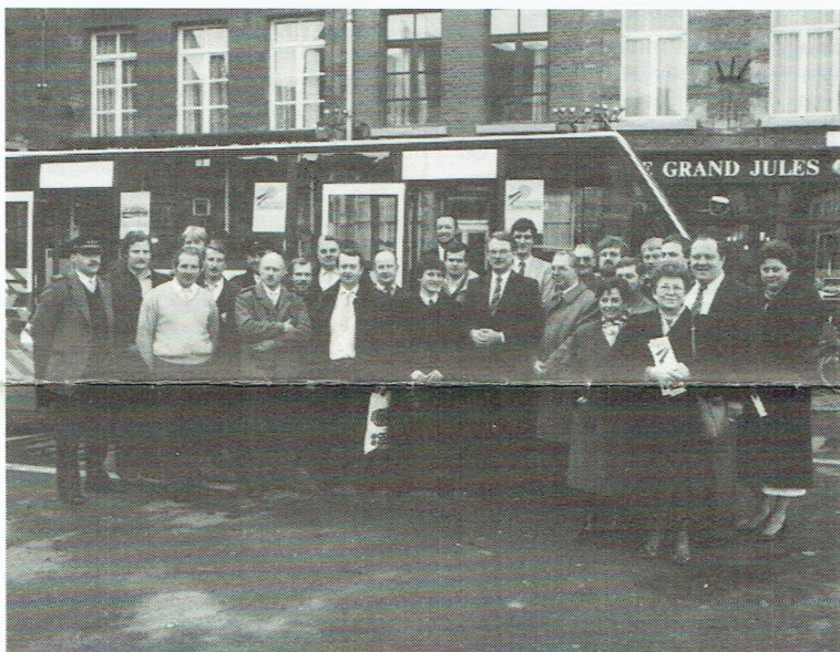
Op deze foto ziet u het merendeel van de personen die betrokken zijn bij het project in Aat : natuurlijk de chauffeurs, de verantwoordelijken van de commerciële dienst en van Henegouwen, en de exploitanten.

Maar ondanks de eenvoudigheid van de actie blijven sommige mensen aan hun gewoontes vasthouden. De rondrit met de Aatbus schept problemen voor hen. Deze midibusjes rijden enkel op donderdagen en