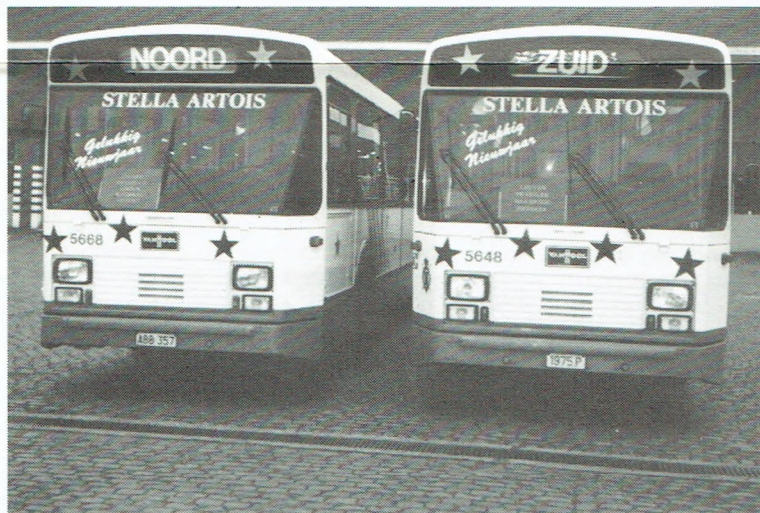
Op de voorruit van de Leuvense nachtbus wisten de NMVB de feestneuzen een gelukkig nieuwjaar.

Wetenswaard is dat in Leuven 100.000 fr. door sponsors, waaronder Stella Artois, in het laatje gebracht werd, in ruil voor reclame op de nachtbus.