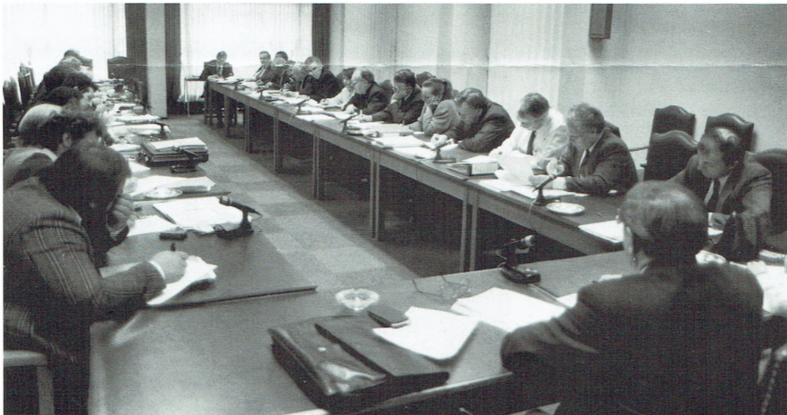
Woensdag 17 en vrijdag 26 januari vergaderde het nationaal paritair comité, arbeiders van de zes maatschappijen voor intercommunaal vervoer, onder voorzitterschap van Marcel Magdaleijns, directeur-generaal algemene diensten bij het federale verkeersministerie, op het Hoofdbestuur over de collectieve arbeidsovereenkomst (CAO) 1990 voor de Miv-arbeiders.

Zo wordt 1990 ook een voor spoedig redactioneel jaar.