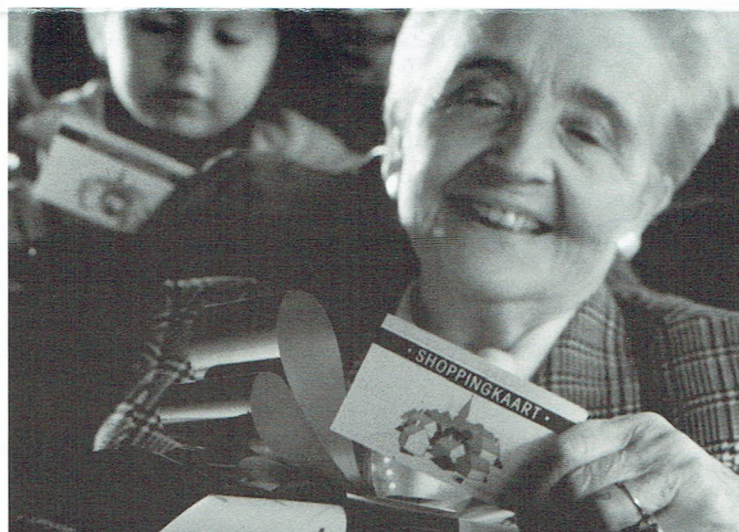
"De actie is heel nuttig en onmisbaar", aldus onze chauffeurs.