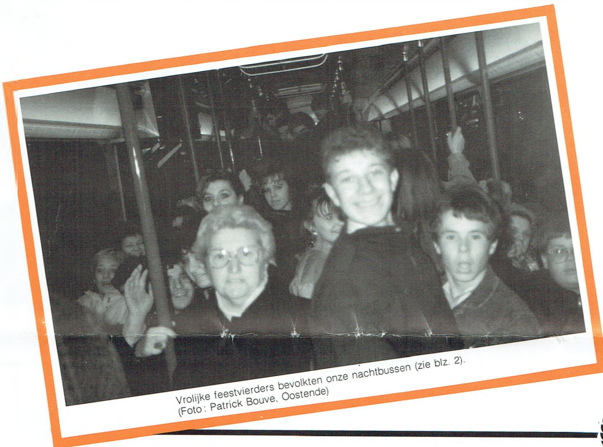
Vrolijke feestvierders bevolkten onze nachtbussen (zie blz. 2).