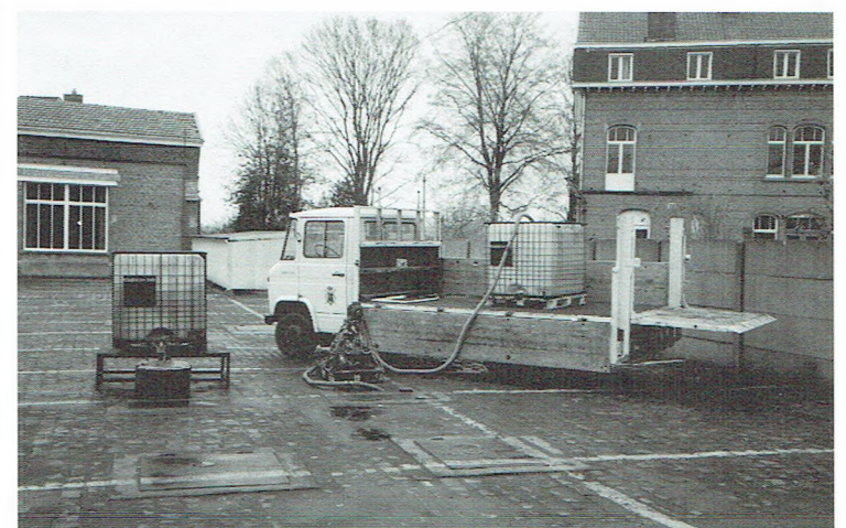
Rechts de situatie in de stelplaats bij het ophalen van olie. Links de situatie in Kessel-Lo bij het storten van deze olie.