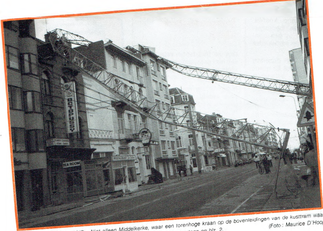
Stormen teisterden NMVB... Niet alleen Middelkerke, waar een torenhoge kraan op de bovenleidingen van de kusttram waaid (foto), maar alle groepen hebben schade geleden. Zie onze reportage op blz. 2.