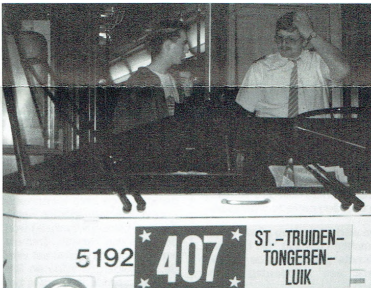
Jongeren zijn gelukkig met een initiatief als de Sterrenbus. De cijfers bewijzen het.

De Sterrenbus schittert al. Dit kan rustig gesteld worden na de eerste resultaten. De eerste zaterdag stapten in totaal 414 jongeren op de bus voor een veilig avondje uit. Daarna liep de klandizie wel terug, maar dit is normaal. Vanaf eind mei buigen de meeste jongeren zich over hun boeken en cursussen. En natuurlijk speelt de Mondiale voor een groot deel mee!