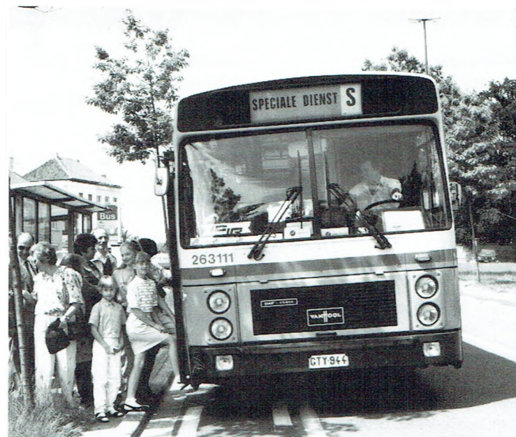
Duizenden bezoekers lieten hun auto op stal. Ze verkozen de Ros Beiaardbus: gemakkelijk, efficiënt en betrouwbaar vervoer.

Zondag 27 mei 1990 staat zeker bij de Dendermondanaren in het geheugen gegrift. Die dag reed immers opnieuw het Ros Beiaard uit en dit voor de laatste keer deze eeuw.