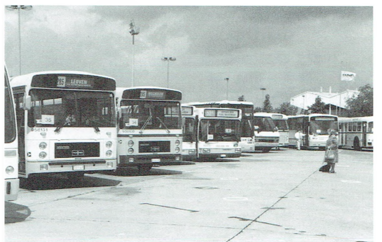
Een hele reeks Buurtspoorwegbussen stonden tentoon voor de Busrally.

De chauffeurs die voor de NMVB reden stelden zich vrijwillig ter beschikking.