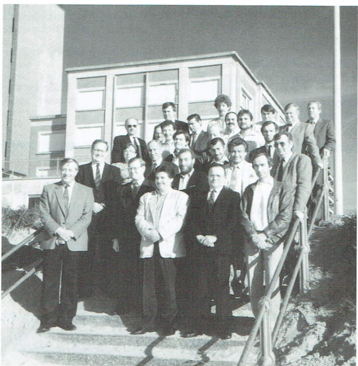
De personeelsleden van Destelbergen zijn trots op het behaalde resultaat

Zaterdag 6 en zondag 7 oktober ek. is het weer Trein-Tram-Busdag. Op deze feestdagen van en voor het openbaar vervoer zetten wij uiteraard ons beste beentje voor. Laat zien tot wat de Buurtspoorwegen in staat zijn.