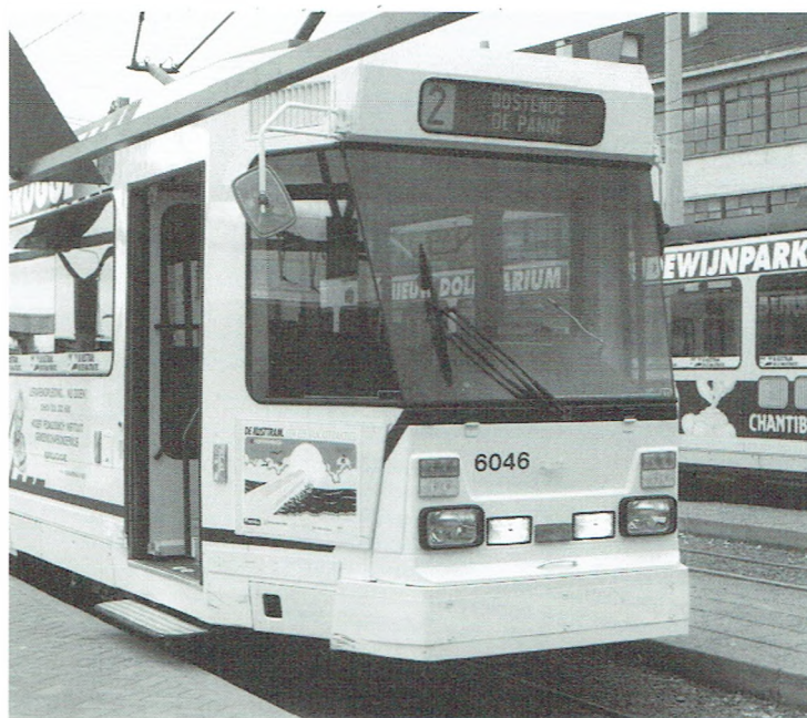
Uit veiligheidsoverwegingen waren wij genoodzaakt het voorste (gevaarlijke) koppelblok te verwijderen.

De jongste jaren berichtte de pers negatief over de automatische koppelingen van onze kusttrams. Ze werden als "moordwapens" omschreven. Bij botsingen was de kans groot dat de koppeling het andere voertuig doorboorde. Daarom ervaren de andere weggebruikers de koppelingen als een bedreiging voor hun veiligheid. Er dient wel gezegd dat in veel gevallen het ongeval veroorzaakt wordt door onoplettendheid van de autobestuurders of andere weggebruikers.