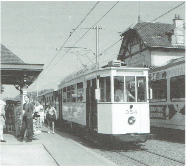
De Haan werd omgetoverd tot de Belle Epoque-stijl. Ook onze oude trammelantjes werden hiervoor van stal gehaald.

De broers Achille en Pierre Rijckaert, fervente tram-liefhebbers, offerden vrijwillig een dag op om de trammelant te besturen.