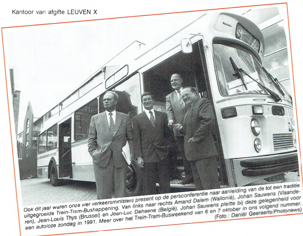
Ook dit jaar waren onze vier verkeersministers present op de persconferentie naar aanleiding van de tot een traditie uitgegroeide Train-Tram-Bushappening. Van links naar rechts Amand Dalem (Wallonië), Johan Sauwens (Vlaanderen), Jean-Louis Thys (Brussel) en Jean-Luc Dehaene (België). Johan Sauwens pleitte bij deze gelegenheid voor een auto-loze zondag in 1991. Meer over het Train-Tram-Busweekend van 6 en 7 oktober in ons volgend nummer.