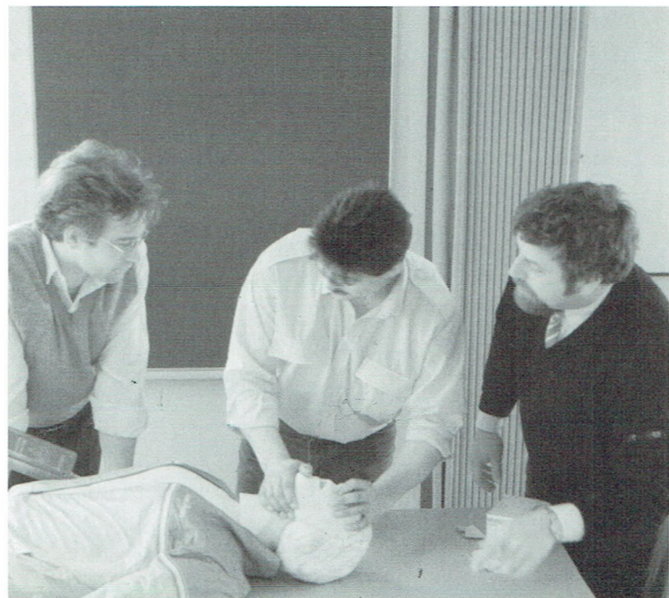
De oefenpop "Resusci Anne" helpt de kandidaat-chauffeurs een heel eind op weg bij het praktisch gedeelte van de EHBO-cursus.

Deze didactische aanwinst be- tekent een welgekome aanvul- ling bij de opleiding van onze kandidaat-chauffeurs.