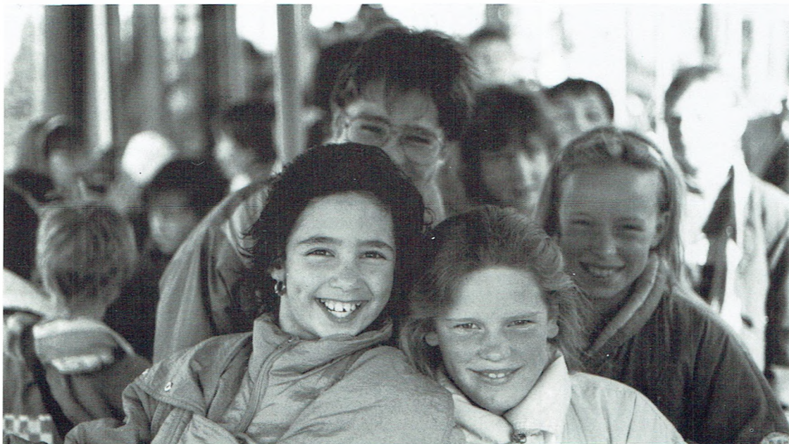
Op onze bussen en trams moeten jong en oud zich happy voelen!

Op het vlak van menselijke relaties ontbreekt een degelijke opleiding. Een permanente nascholing is volgens de minister geen overbodige luxe. In de Vlaamse Vervoermaatschappij zal trouwens veel aandacht geschonken worden aan dergelijke opleiding.