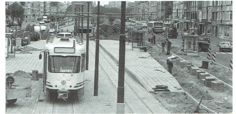
De eerste bovengrondse tramhalte op Linkeroever. Hier kan veilig en comfortabel overgestapt worden van tram op streekbus of omgekeerd. Deze foto werd genomen op donderdag 6 september 1990.