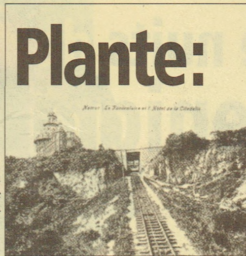
L'arrivée à l'hôtel

entreprise namuroise, démarrèrent en 1896. Le parcours définitif conduisait du Tienne des Biches au hall vitré de l'hôtel, en enjambant la gorge du Bulley. A compter de cette date, fut donc possible de rallier l'esplanade de la Citadelle en train. Il faut croire que l'idée, sans doute trop ambitieuse, ne rencontra pas le succès espéré puisque l'exploitation ne dura pas plus d'une dizaine d'années.