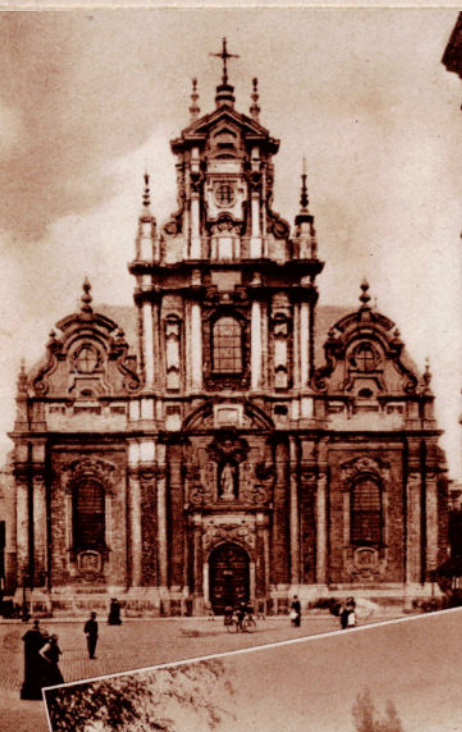
BRUXELLES. — Eglise du Béguinage.

La plupart des béguinages qui nous ont été conservés datent du commencement du XVII e siècle. Mais tous montrent des détails et des particularités, tels les noms de saints sur l'huis de chaque maisonnette, la Pieta au portail de l'église, caractéristiques du XV e ou même du XIV e siècle. Une visite des différents béguinages dévoilera des existences éteintes qui survivent dans le décor antique.