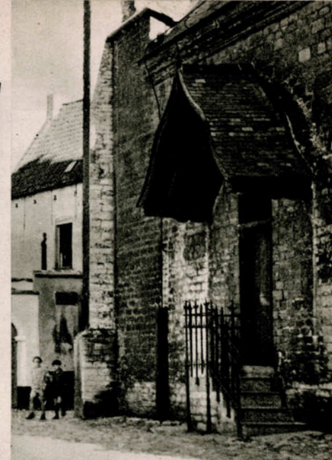
MALINES. — Entrée de l'Église du Béguinage.