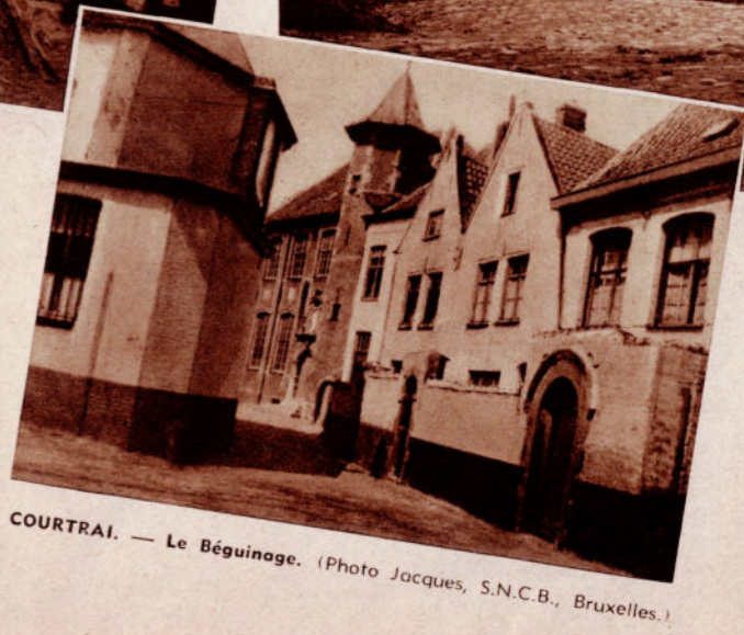
COURTRAI. — Le Béguinage.