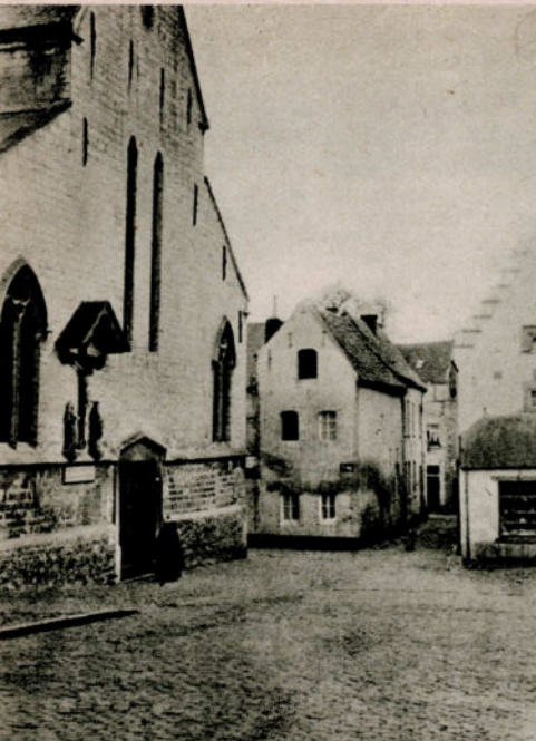
TONGRES. — Béguinage avec église (XIII e siècle).

TOURNAI. — A Tournai, on trouve encore quelques vestiges d'un béguinage dans le voisinage de l'église de la Madeleine.