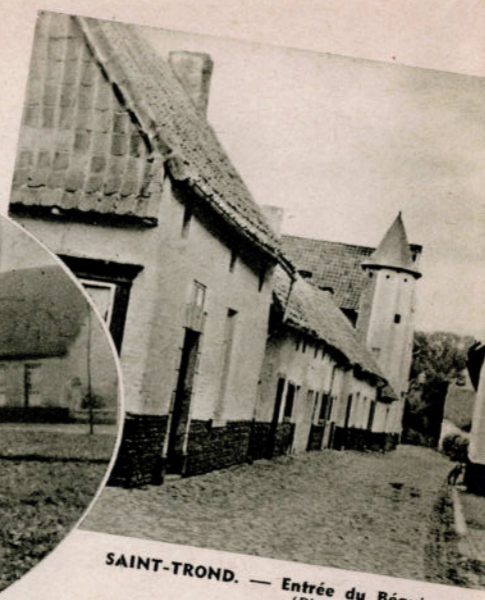
SAINT-TROND. — Entrée du Béguinage.