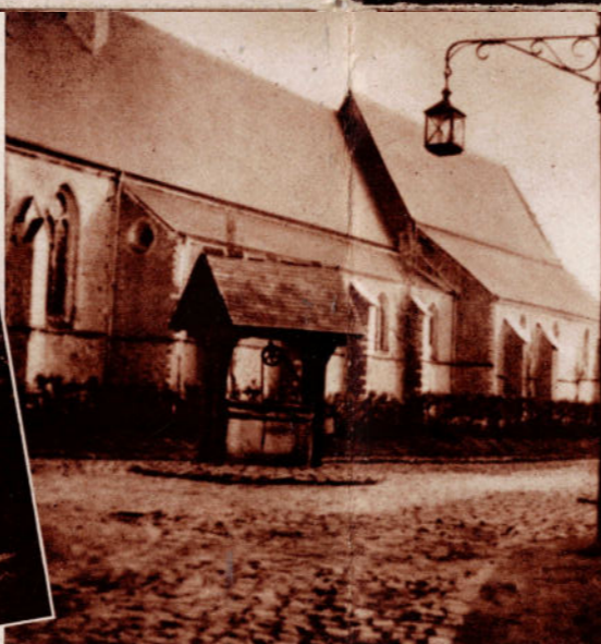
SAINT-TROND. — Vieux puits du Béguinage.