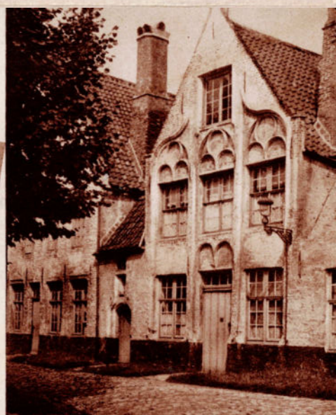
COURTRAI. — Le Béguinage.