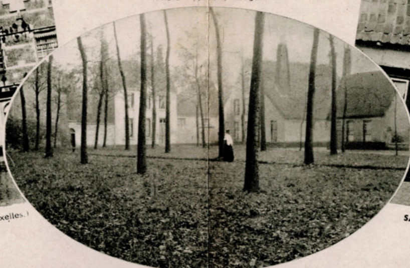
BRUGES. — Béguinage en automne.