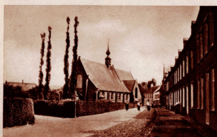
HERENTALS. — Béguinage.