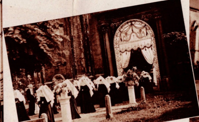
GAND. — Petit Béguinage. Procession.