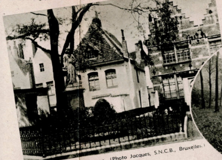
COURTRAI. — Le Béguinage.