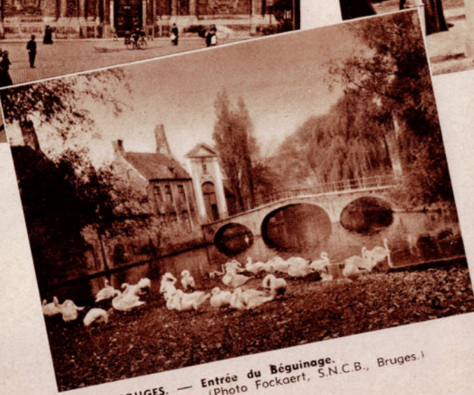
BRUGES. — Entrée du Béguinage.