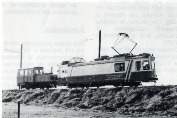
Une motrice spécialement équipée contrôle la ligne aérienne.

de 585 millions de francs. Le gasoil routier nous a coûté 568,3 millions et le gasoil de chauffage 24 millions. Pour l'ensemble de l'année 1987, nous avons enregistré une hausse moyenne de l'indice des prix à la consommation de 1,56 % seulement. Ainsi, l'approvisionnement en biens de consommation a coûté à la SNCV 3,68 % de moins qu'en 1986. Cette baisse est due à la réduction de 4,1 % du prix d'achat moyen du gasoil routier et de 3,28 % du prix de revient des autres biens de consommation.