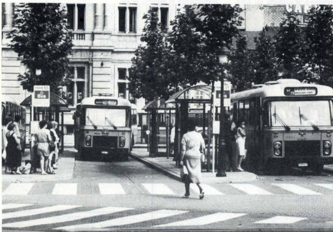
Pour transporter ses voyageurs, notre Société dispose de 2.334 autobus.

Pol Watelet rue de la Science 14 1040 Bruxelles