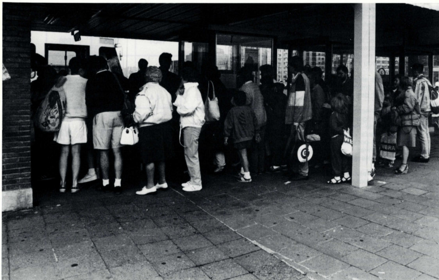
Quel qu'en soit le type, les titres de transports se sont moins bien vendus l'an dernier.