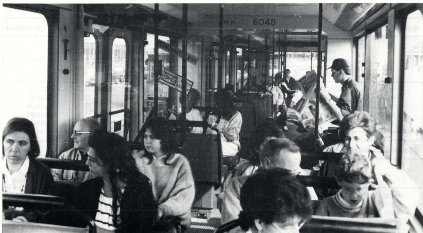
En 1987, nos tramways ont transporté 7.880.000 voyageurs.