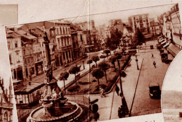
VERVIERS. — Place Verte.