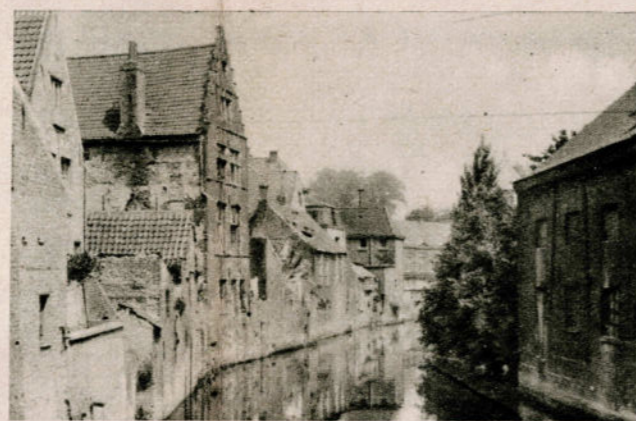
AUDENARDE. — Bras de l'Escaut.