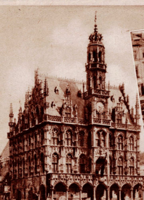
AUDENARDE. — Hôtel de Ville.