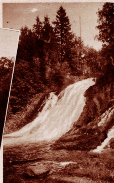
COO. — La Cascade.

JOIGNANT L'UTILE A L'AGREABLE, LA SOCIETE NATIONALE VOUS OFFRE SES SERVICES SPECIAUX