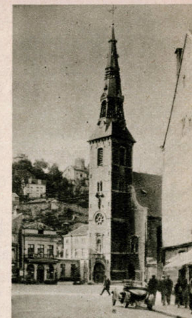
Verviers. — Eglise Notre-Dame.

L'hôtel de ville; le Monument de la Victoire, le Théâtre, le Monument David, la statue Chapuis, l'Hôtel des Postes, le Monument Ortmans-Hauzeur, l'église St-Remacle, le Musée Communal, l'église Notre-Dame.