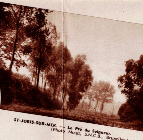
ST-JORIS-SUR-MER. — Le Pré du Seigneur.