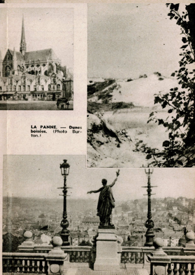
VERVIERS. — Panorama.