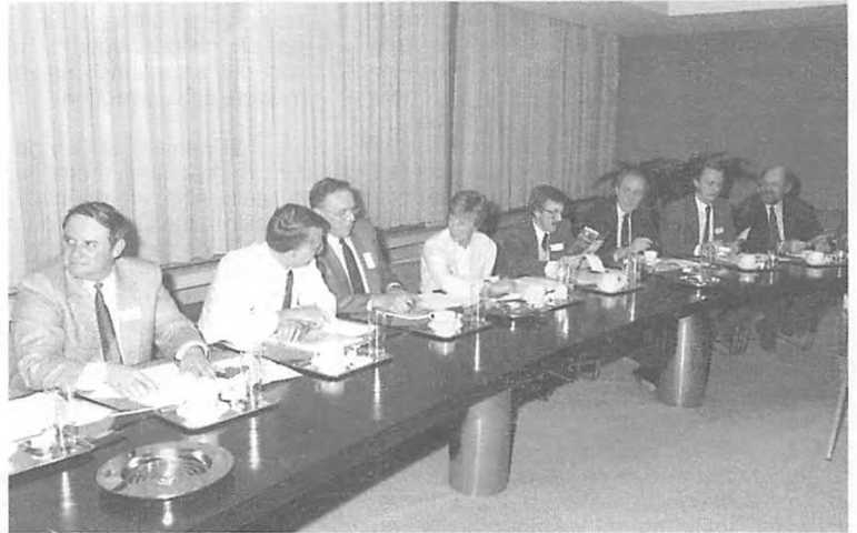
Enkele van de 25 directeurs van openbaar vervoerbedrijven bij ons te gast tijdens een voorlichtingsvergadering gehouden in de nieuwe vergaderzaal.

Zo zie je maar dat niet alleen door de werkgevers bedrijfsbezoeken worden afgelegd. In het kader van de personeelsvereniging worden er immers jaarlijks zo'n drietal uitstappen georganiseerd naar binnen- en buitenlandse zusterbedrijven.